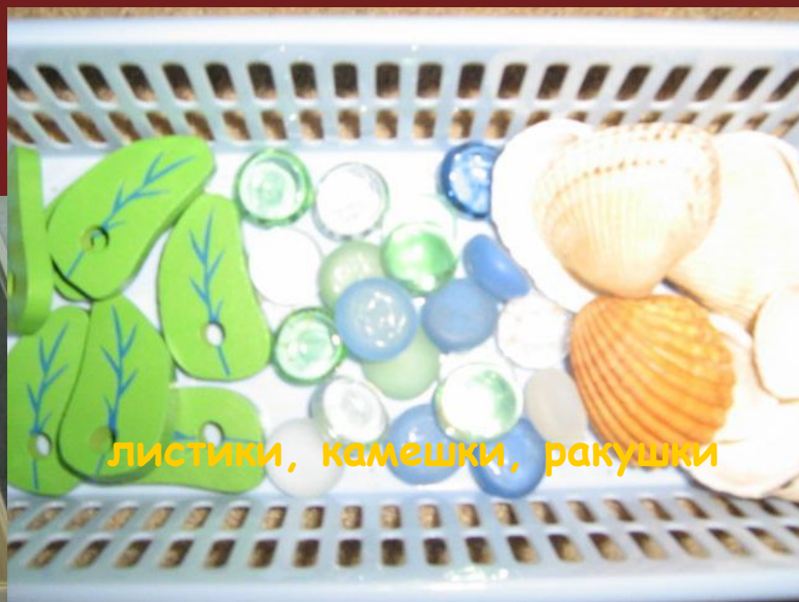
листки, камешки, ракушки