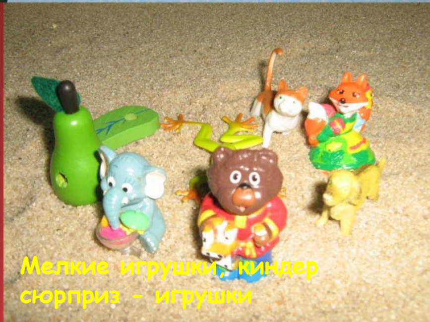
Мелкие игрушки, киндер сюрприз - игрушки