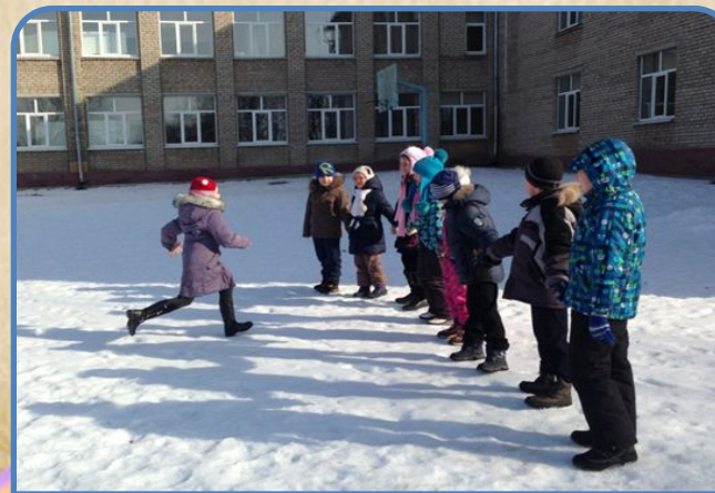
«Игры народов мира»