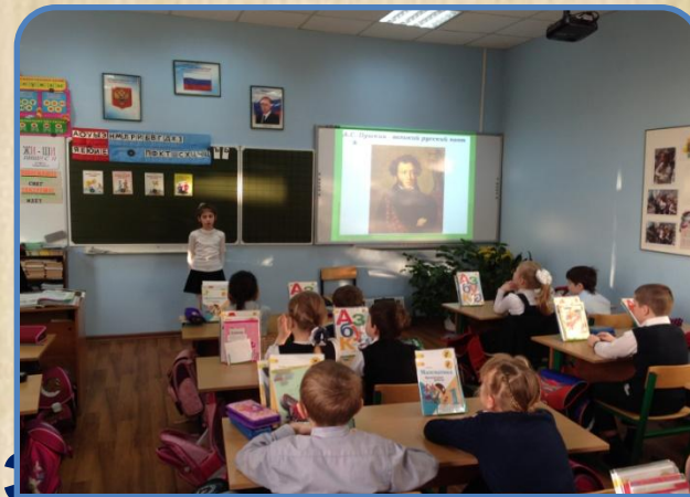
«Мир культуры мир»