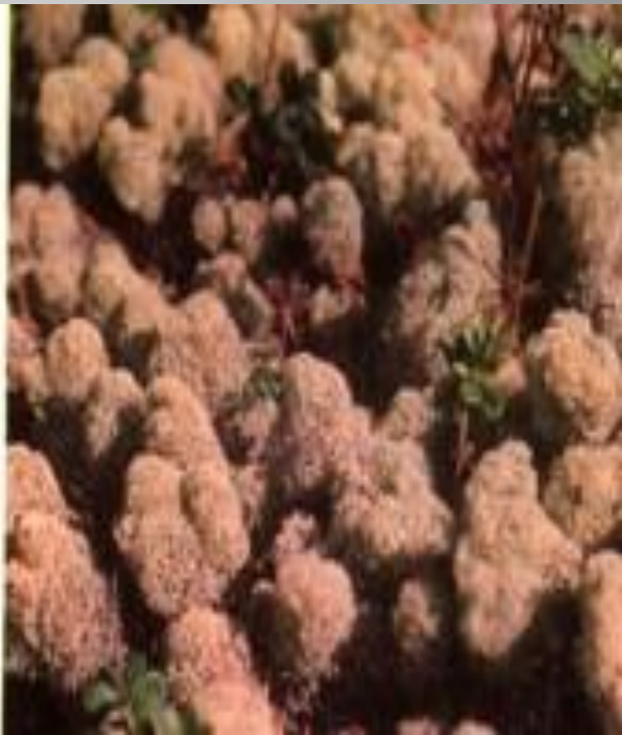
Арктическая красная толочнянка. Лишайник кладония.