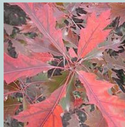
Дуб красный, или северный