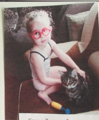
Кошка Дуся приболела, Ей на помощь поспешу... Градусник под мышку вставлю И таблетки пропишу! Епонешникова 25/04/2018