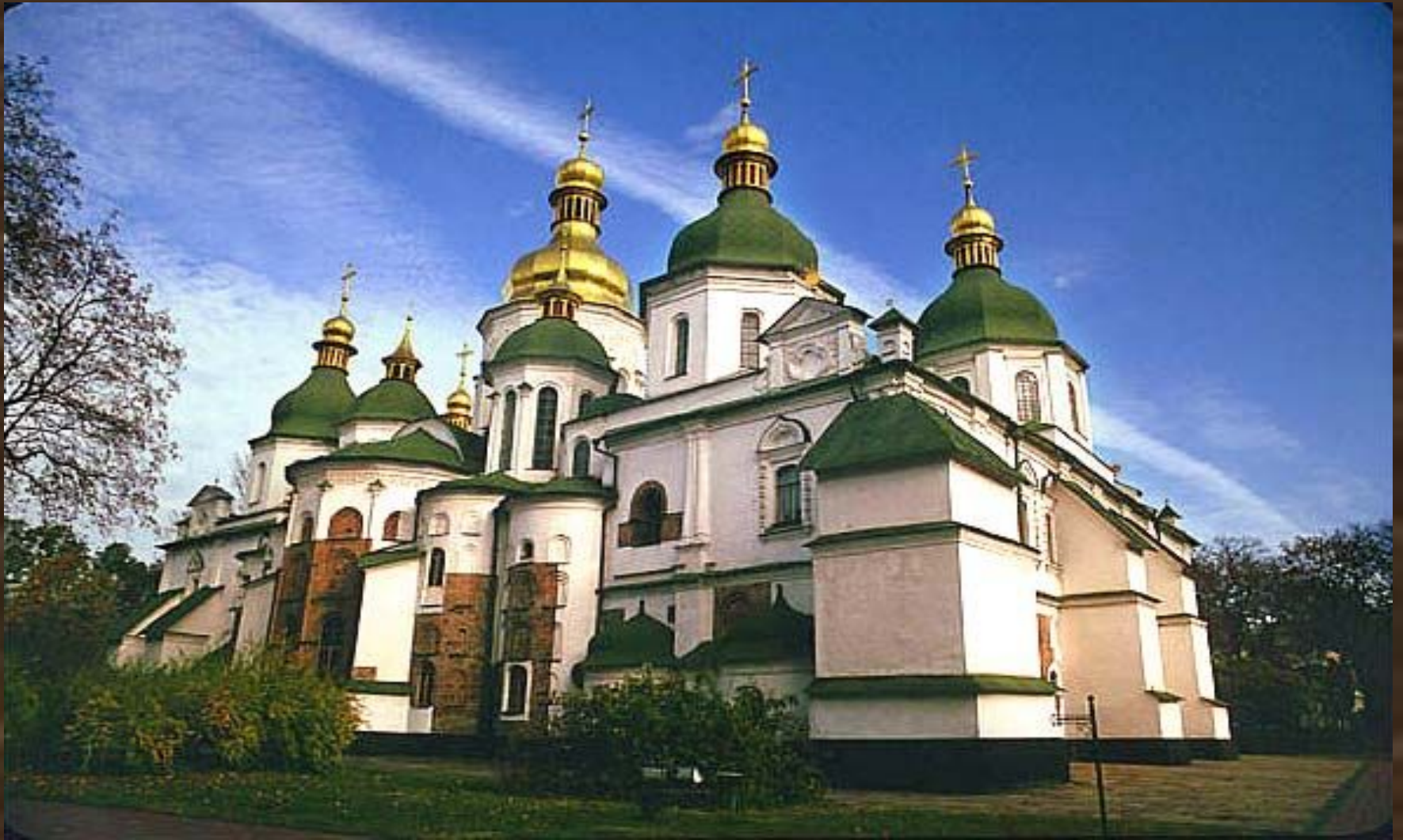
Киев. Софийский собор (Св. Софии). Выдающийся памятник древнерусской архитектуры 11 в.