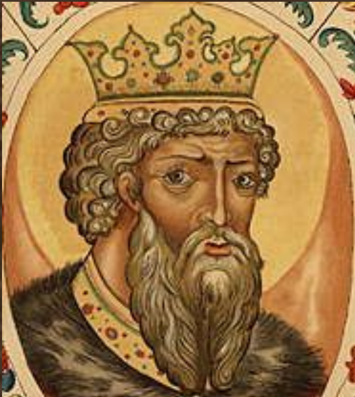
Великий князь Владимир Красно Солнышко