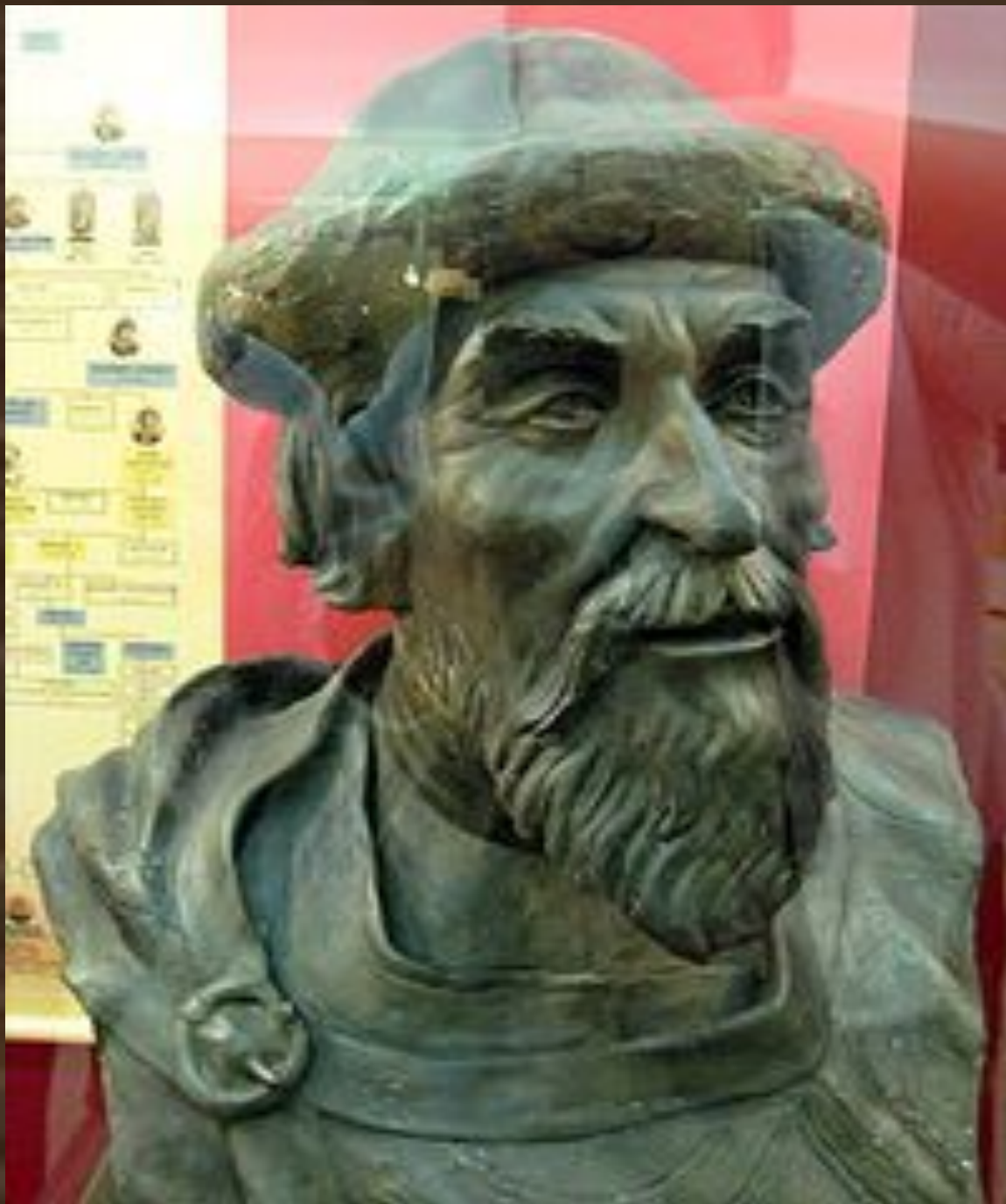
Ярослав Мудрый. Реконструкция по черепу, академик М. М. Герасимов