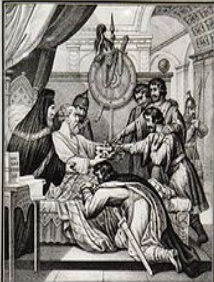
НАСТАВЛЕНИЕ ЯРОСЛАВА СЫНОВЬЯМЪ 1054

(Повесть временных лет под 1054 годом, перевод Д. С. Лихачева)