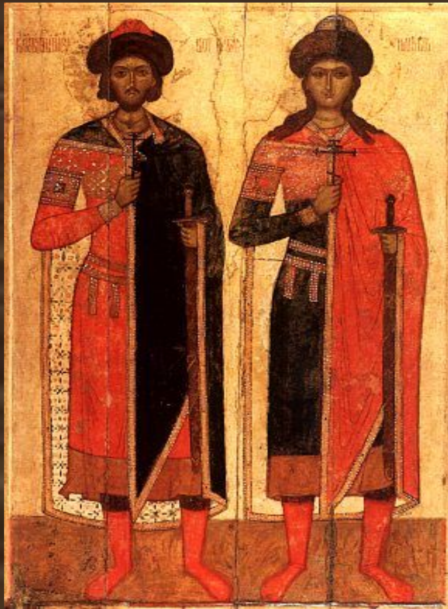
Борис и Глеб - младшие сыновья святого равноапостольного князя Владимира