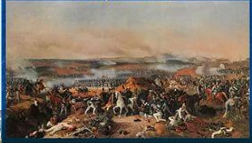
Бородинское сражение 26 августа 1812 года