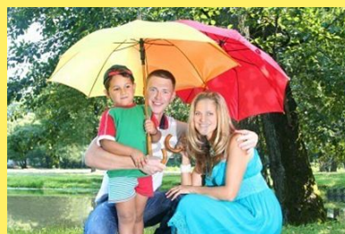
прогулка в парке