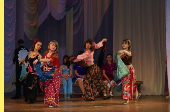
совместные культурные мероприятия