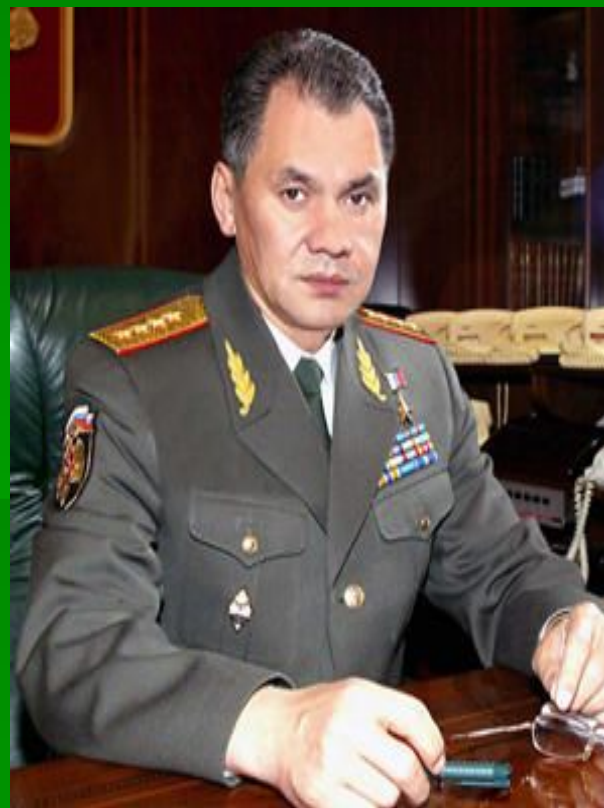
Министр Обороны Российской Федерации С.Шойгу