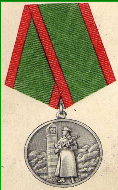
Медаль «За отличие в охране государственной границы»