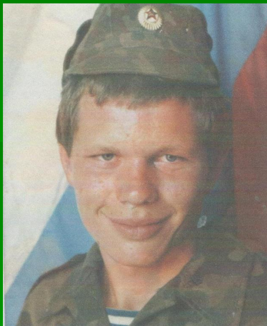
Платонов Сергей Федорович