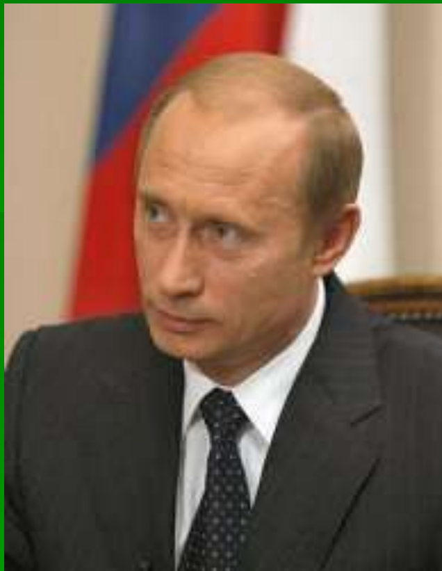
Главнокомандующий Российской Федерации В.В.Путин