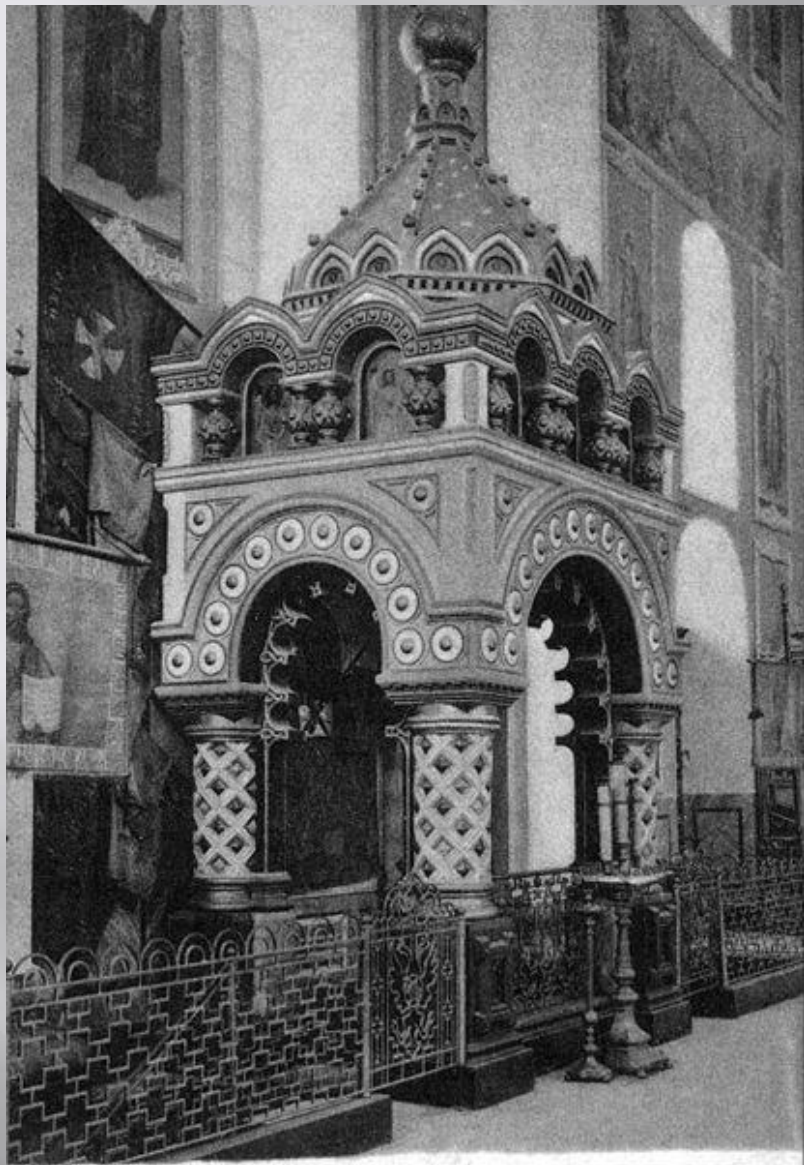
Гробница К.Минина в Михайлово-Архангельском соборе(г.Нижний Новгород)