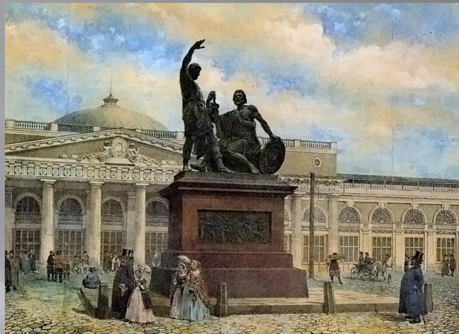
Памятник Кузьме Минину и Дмитрию Пожарскому в Москве.

Гражданину Минину и князю Пожарскому благодарная Россия