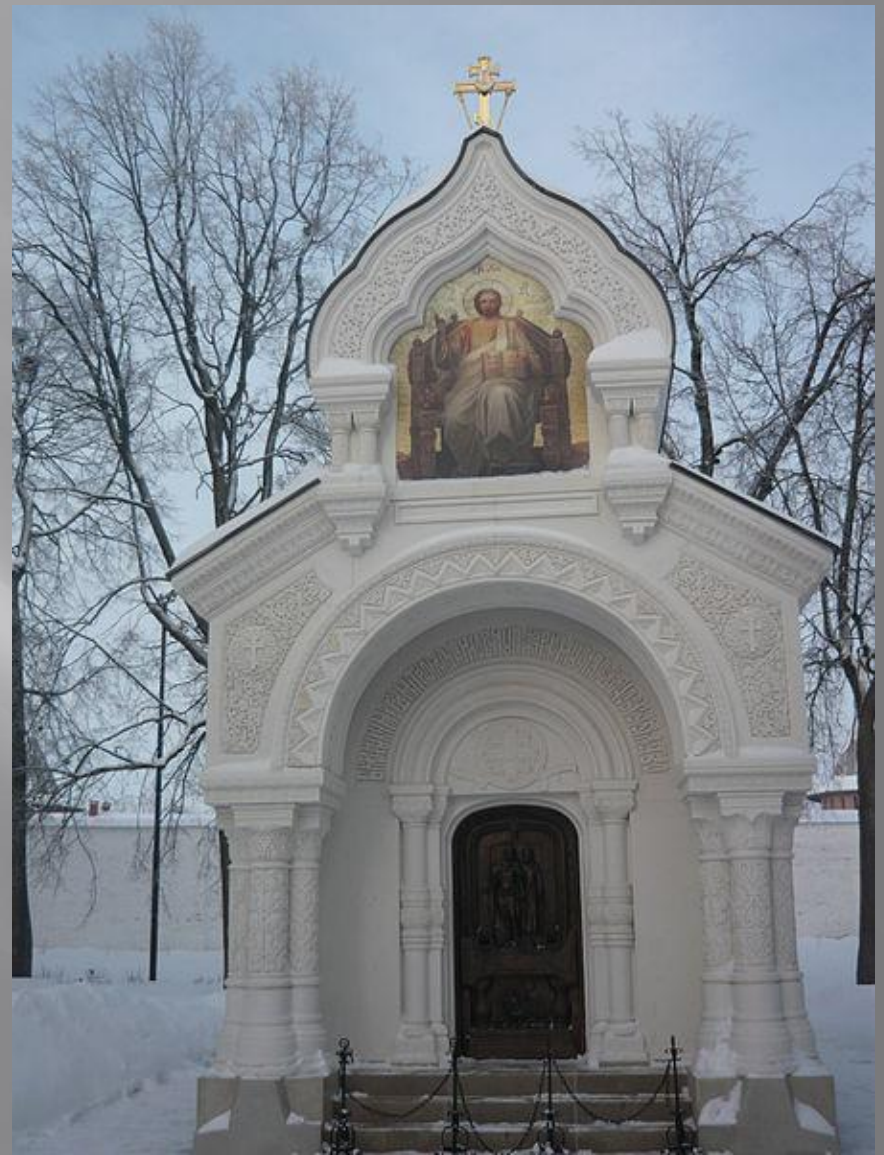
Гробница Д.Пожарского в Спасо-Евфимиевом монастыре (г.Суздаль)