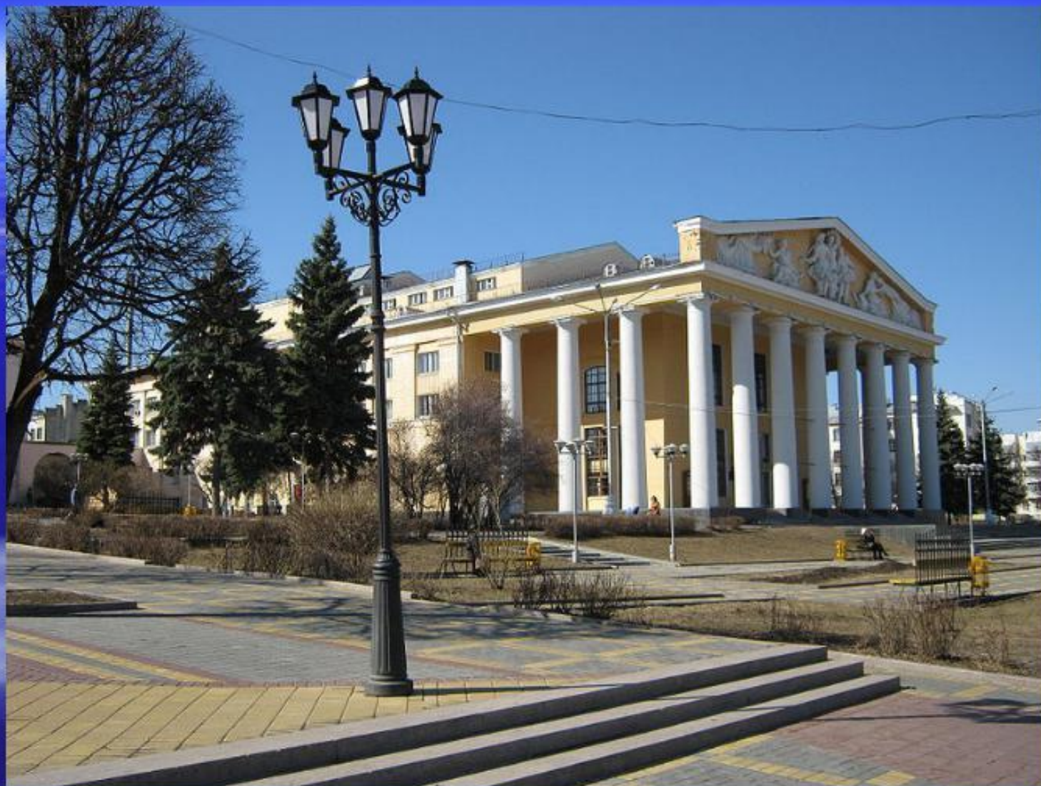
Чувашский академический театр драмы имени К.В.Иванова