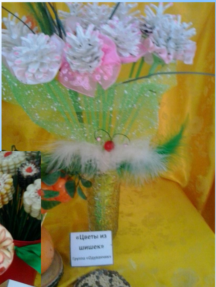
«Цветы из шишек» Группа «Одуванчик»