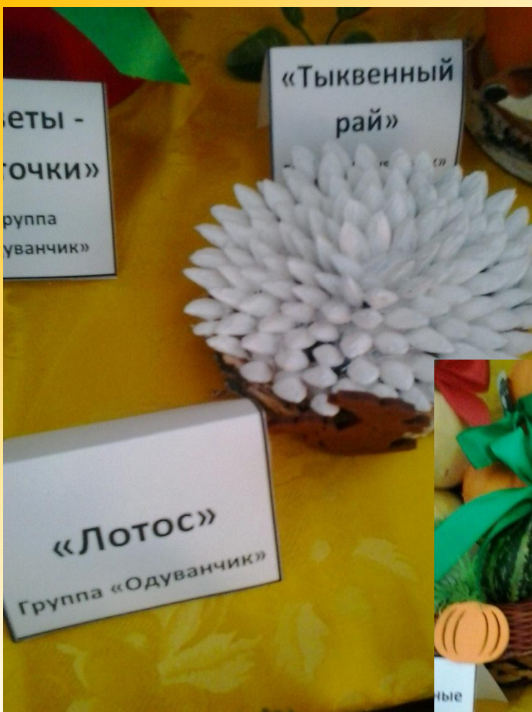
«Тыквенный рай» Группа «Одуванчик»