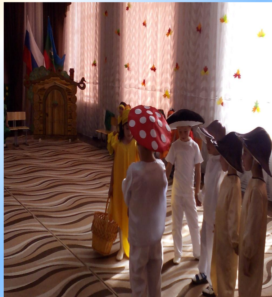
Сценка «Сбор грибов»