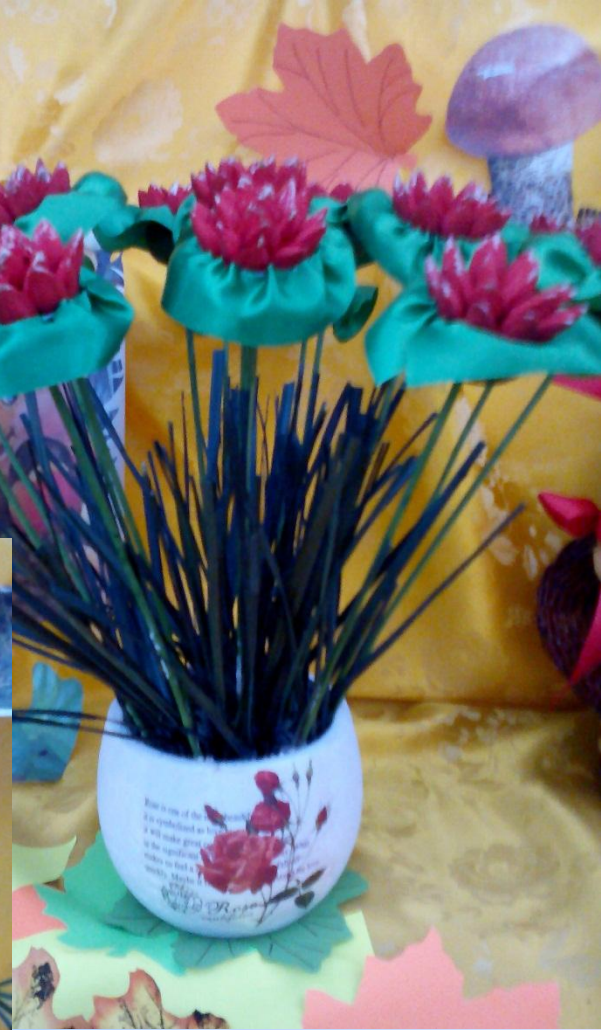
Выставка: «Дары осени»