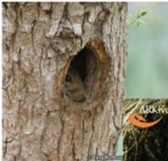
Бельчата в гнезде