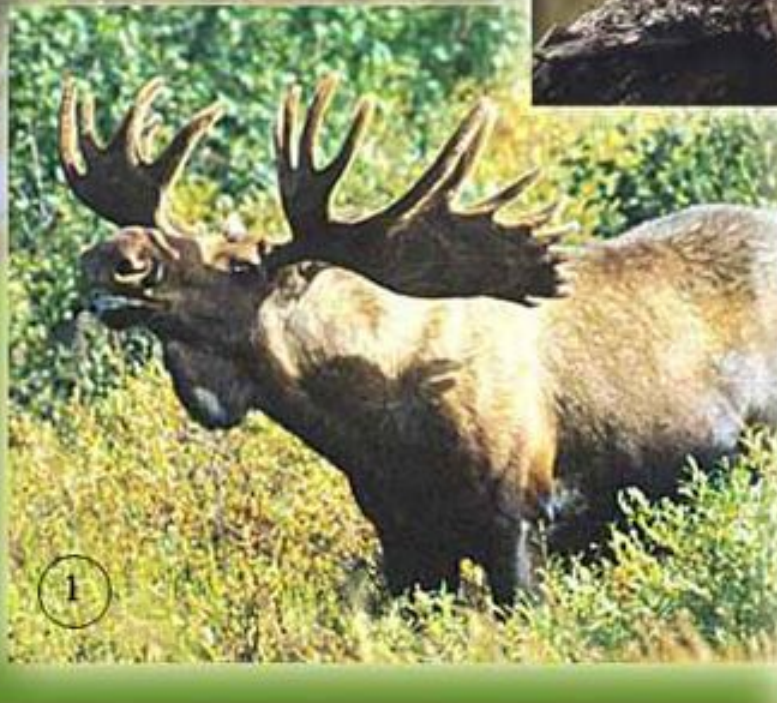
1.Лось 2.Кабарга 3.Бурый медведь 4.Рысь 5.Соболь 6.Бурундук 7.Глухарь 8.Клест