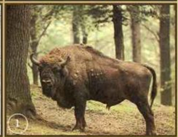
1.Зубр 2.Благородный олень 3.Кабан 4.Лиса 5.Сойка 6.Неясыть 7.Жук-олень