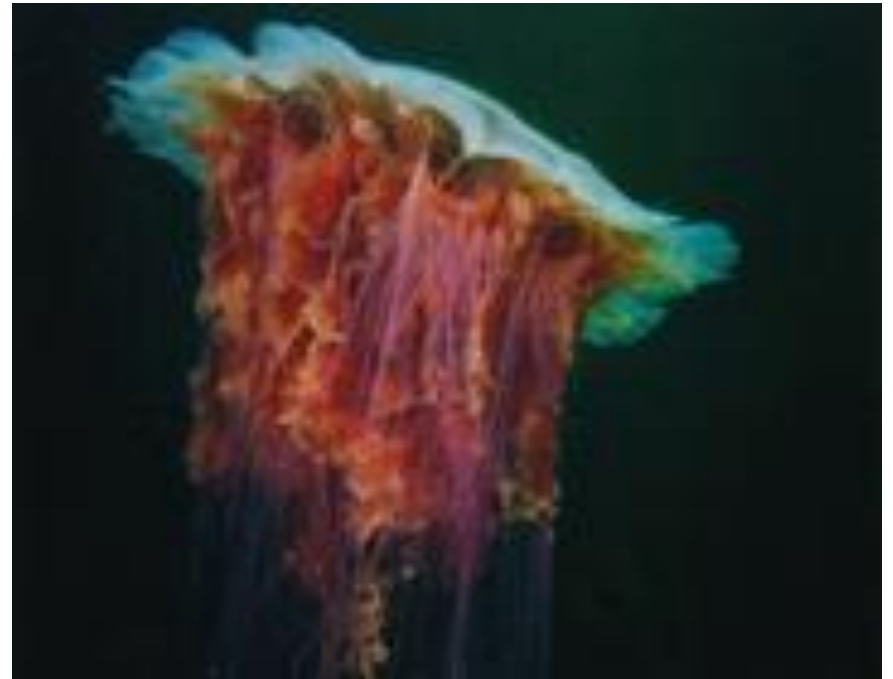
большая медуза- арктическая цианея