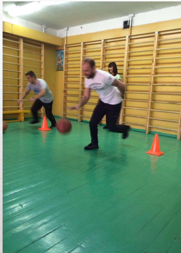
Спортивный праздник в начальной школе