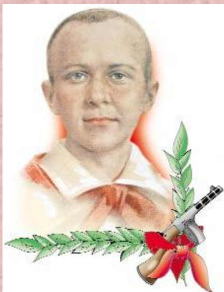
Марат Казей 1929-1944