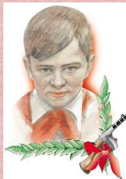
Валентин Котик 1930—1944