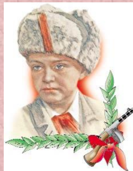
Лёня Голиков 1926 -1943