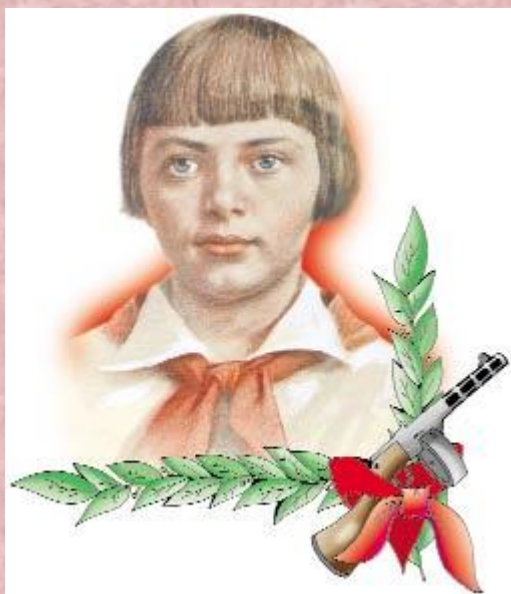
Зинаида Портнова 1926-1944