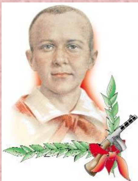
Марат Казей 1929-1944