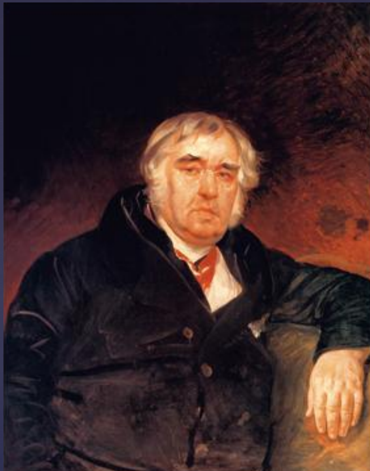
Иван Андреевич Крылов