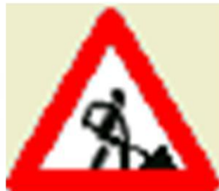
• Дорожные работы