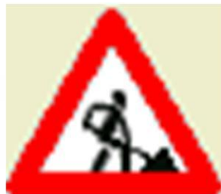
• Дорожные работы