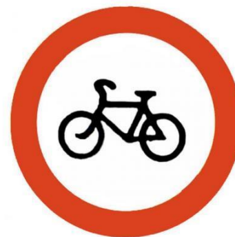
Движение на велосипедах запрещено