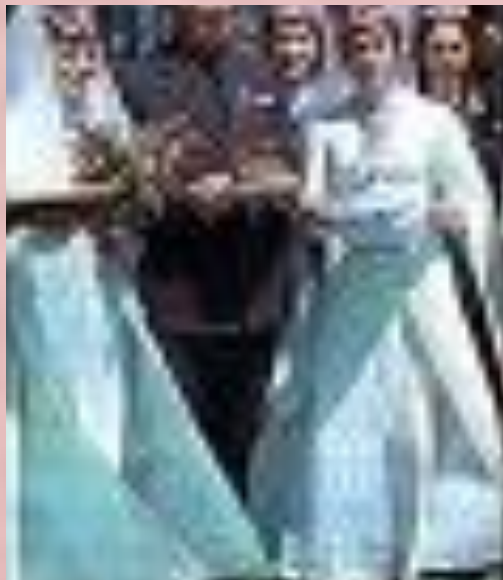
Дружба народов Кавказа