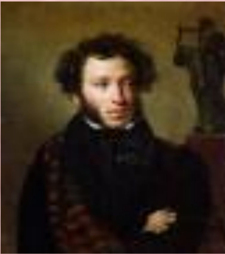
А. С. Пушкин