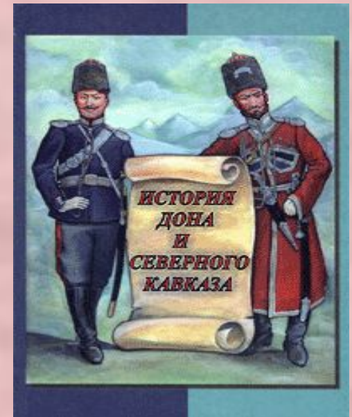
Дон и Кавказ