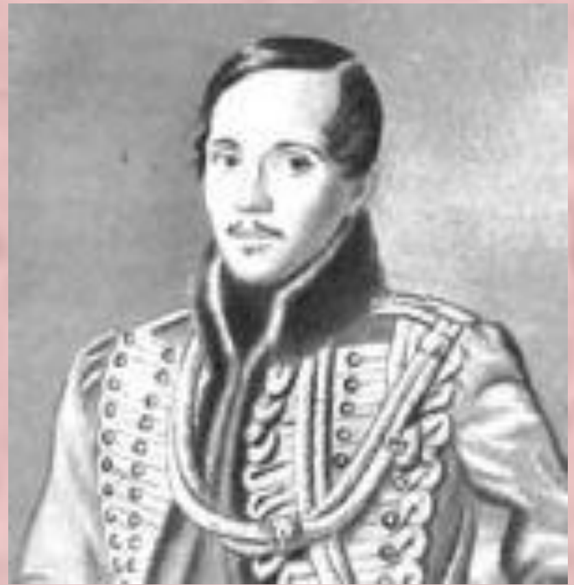
М. Ю. Лермонтов