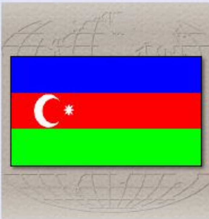
Государственный флаг Азербайджана.