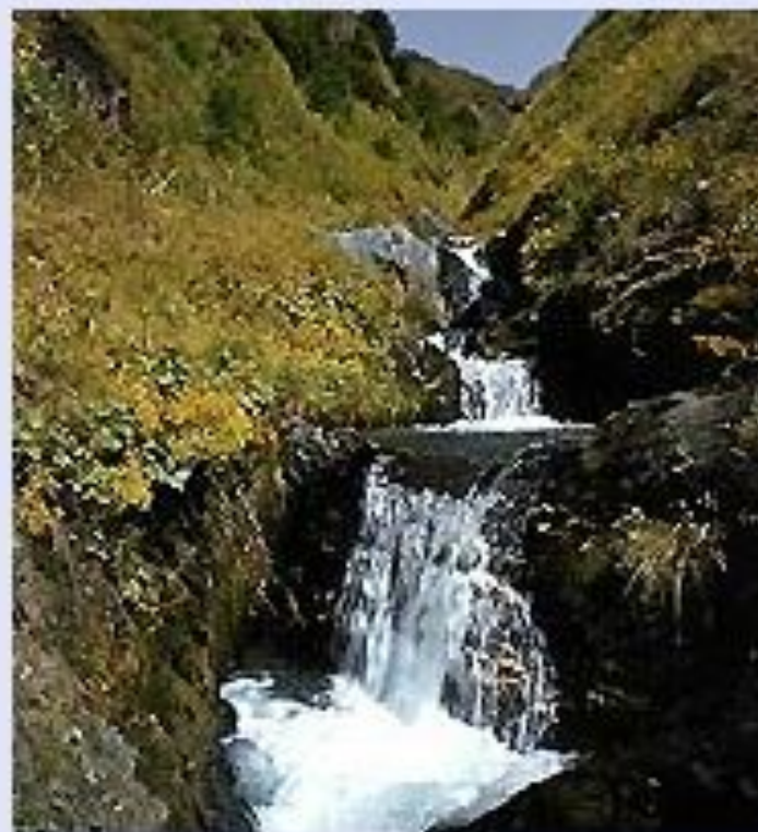
В Закатальском заповеднике.