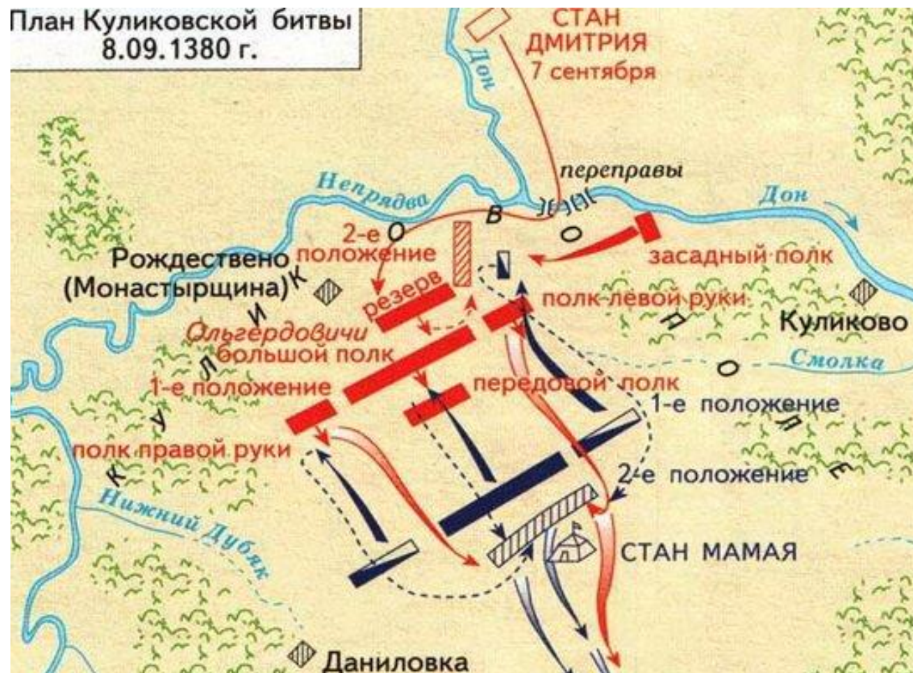
План Куликовской битвы 8.09.1380 г.

- Князь Дмитрий прибегнул к хитрости. Основные силы русской армии выстроились в классической манере. Впереди стоял «большой полк», который должен был сдерживать главный натиск противника, по краям располагались полк правой и левой руки. Вместе с тем было решено использовать Засадной полк, который был скрыт в лесной чаще. Этот полк возглавили лучшие князя Дмитрий Боброк и Владимир Серпуховский.