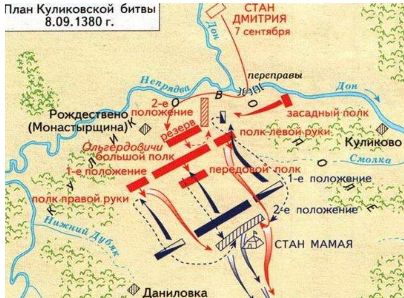
План Куликовской битвы 8.09.1380 г.

- Князь Дмитрий прибегнул к хитрости. Основные силы русской армии выстроились в классической манере. Впереди стоял «большой полк», который должен был сдерживать главный натиск противника, по краям располагались полк правой и левой руки. Вместе с тем было решено использовать Засадной полк, который был скрыт в лесной чаще. Этот полк возглавили лучшие князья Дмитрий Боброк и Владимир Серпуховский.