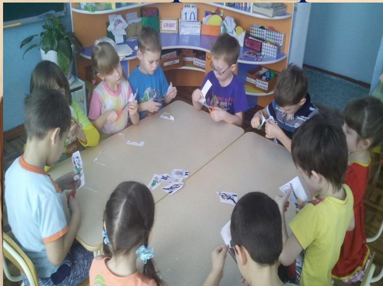
Вырезание профессий людей