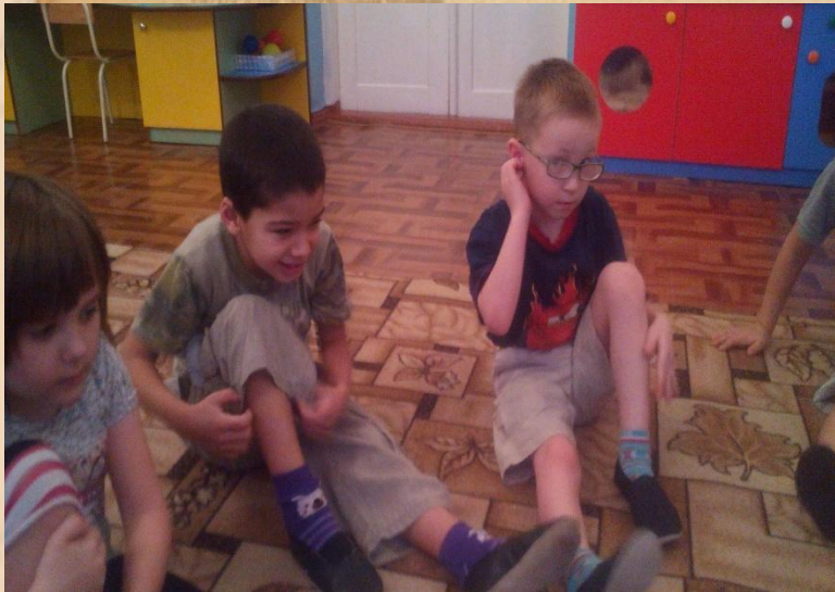
Ритмическое упражнение на полу: «Мы в профессии играем».