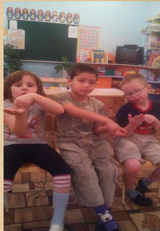
Пальчиковая игра: «Много есть профессий разных»