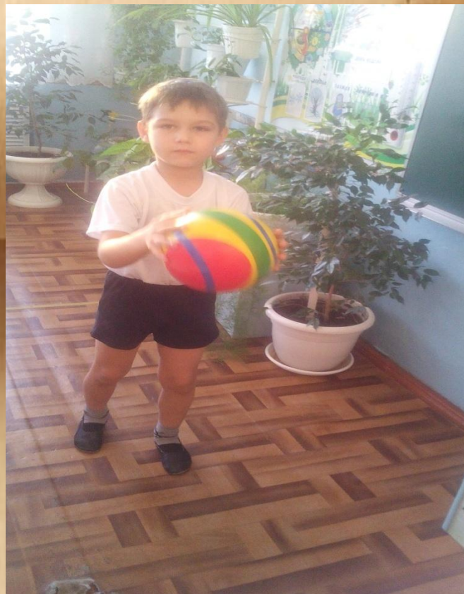
Ритмическое упражнение с мячом «Профессии есть разные...»