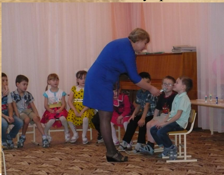
Речевое упражнение :«Интервью»