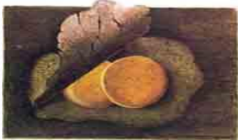
Два приоткрытых яйца