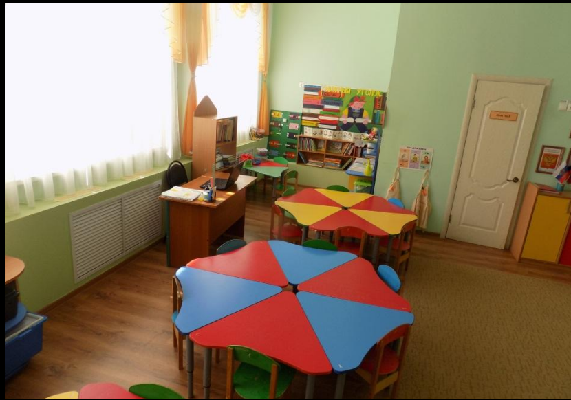
Верхняя правая точка