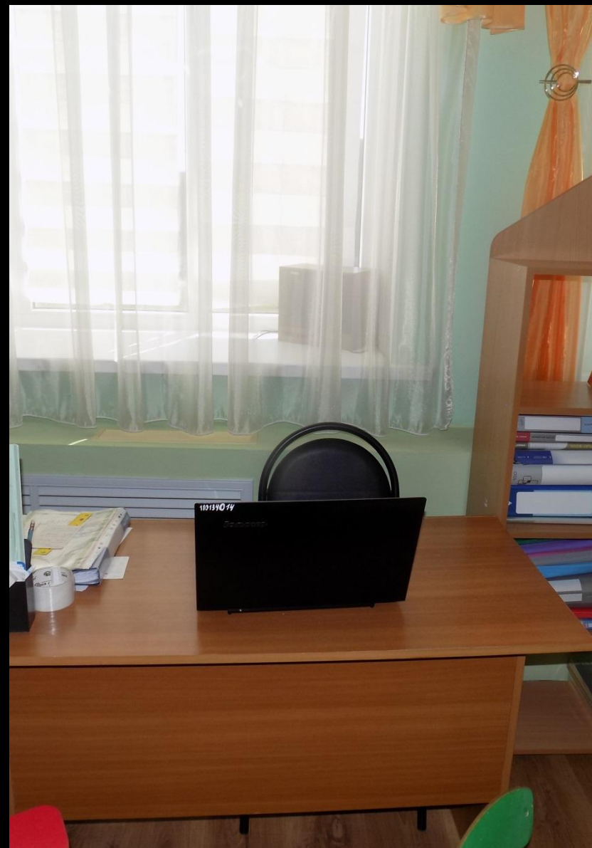
1.7. Рабочий сектор (ИКТ для педагога)