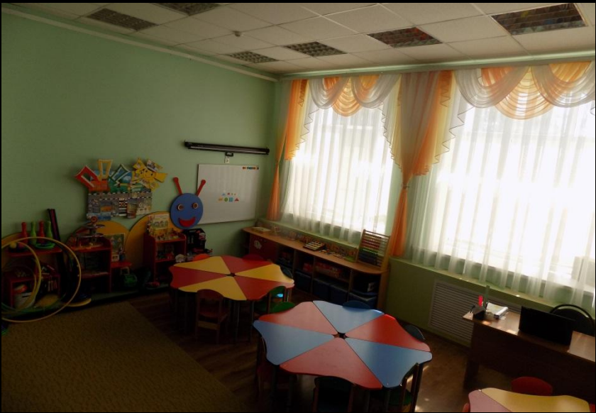
Верхняя левая точка