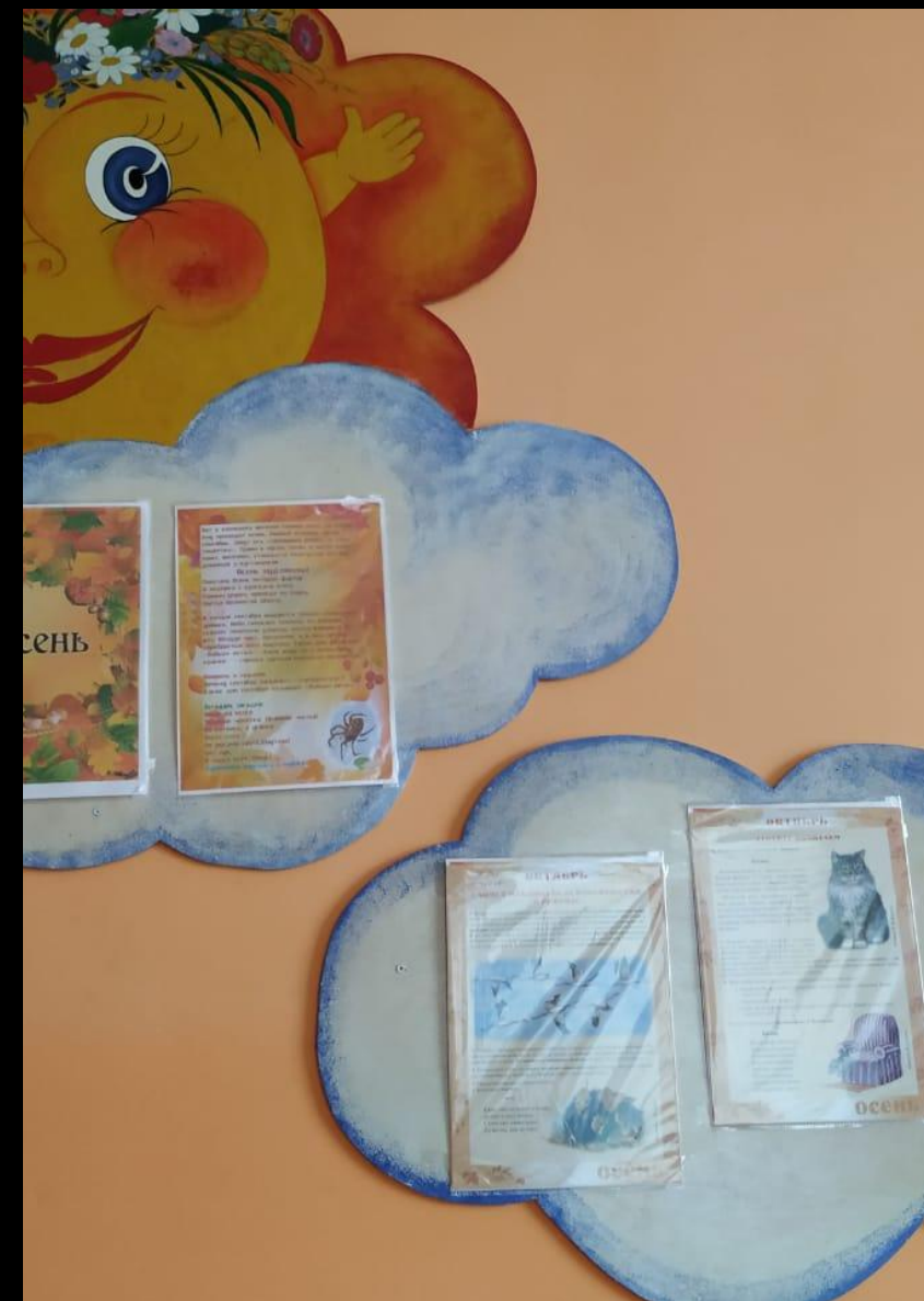
Среда для диалога с родителями