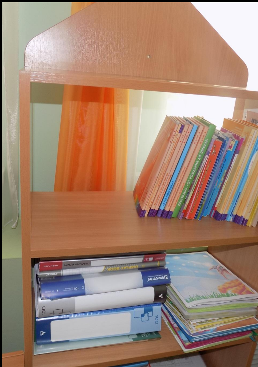
1.6. Рабочий сектор (методическая литература педагога)