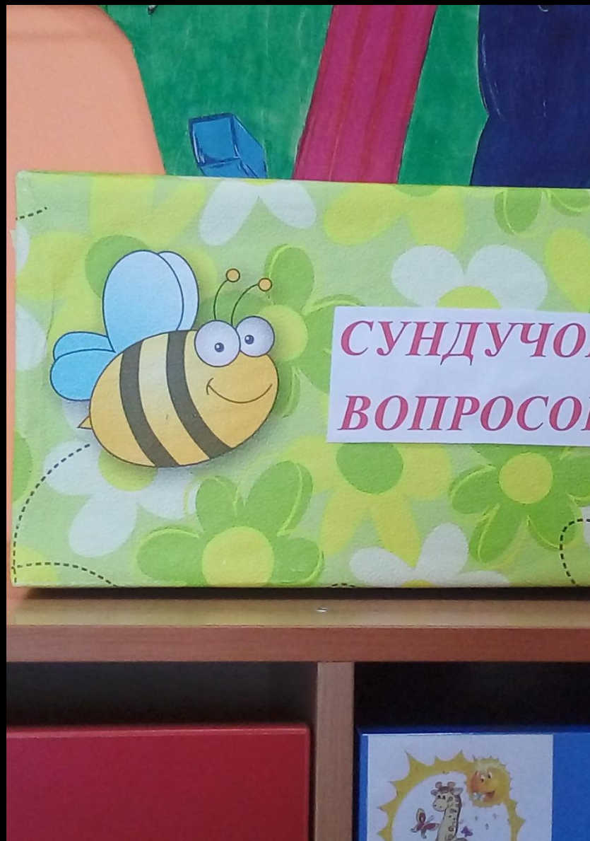
Среда для диалога с родителями