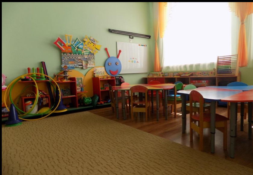
Вход в группу, нижняя левая точка