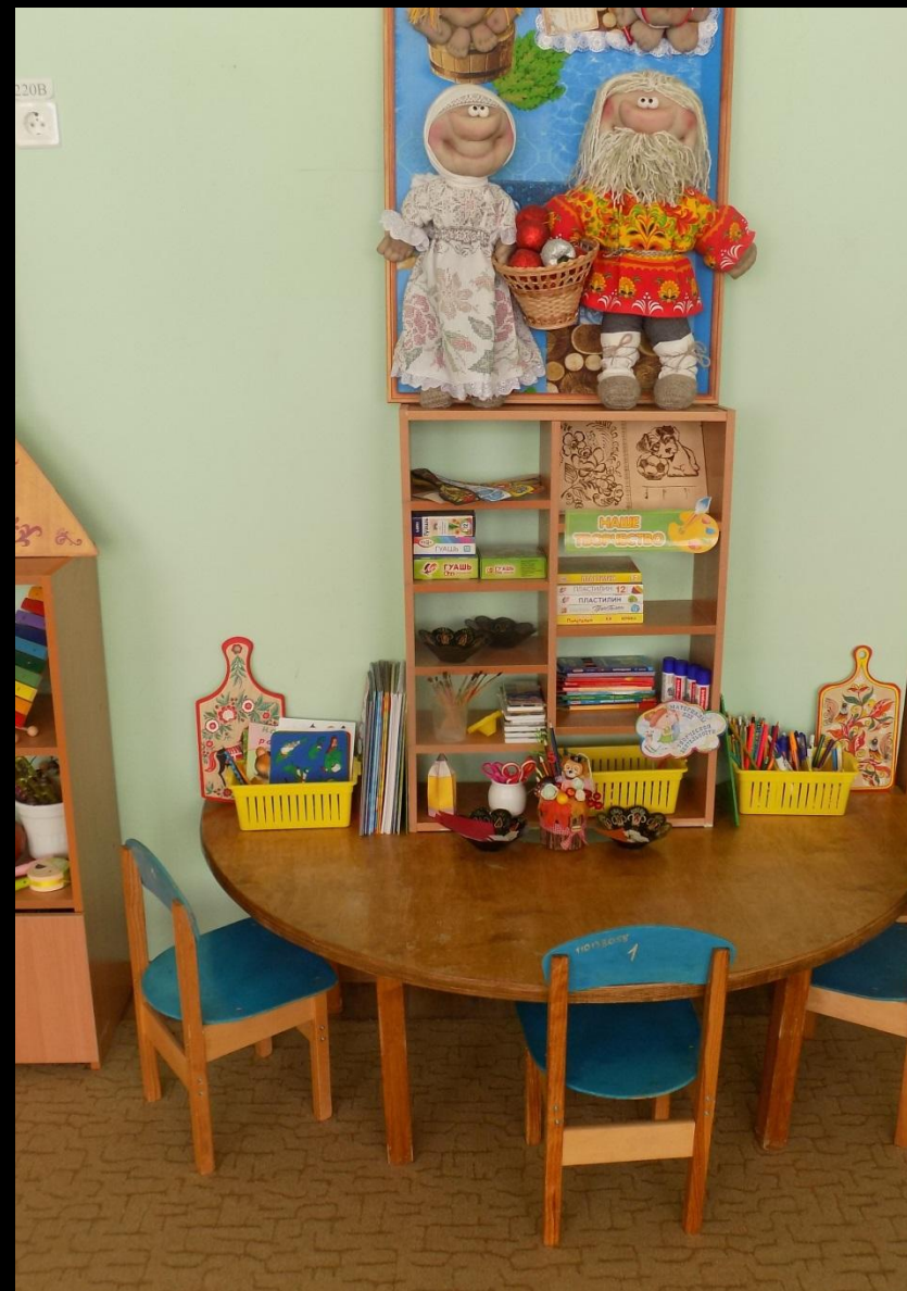
2.2.5. Активный сектор