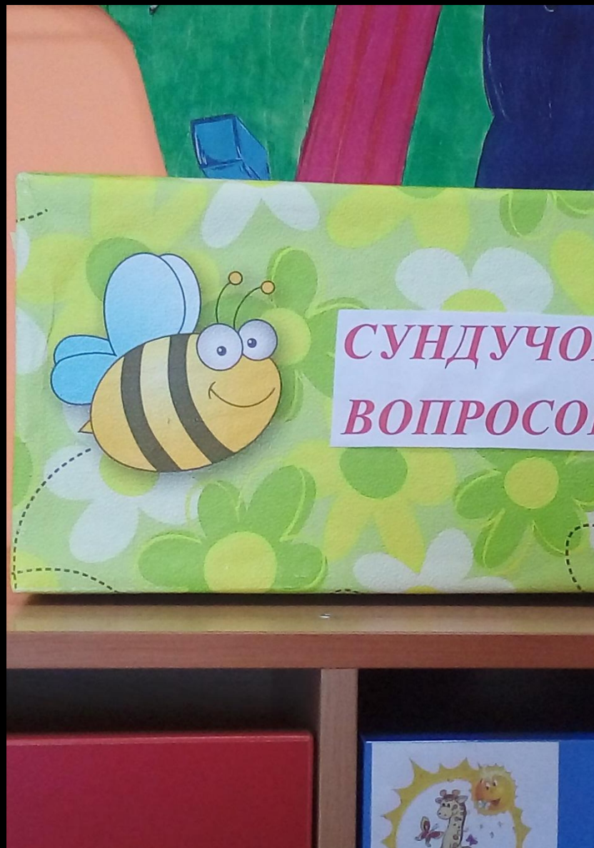
Среда для диалога с родителями