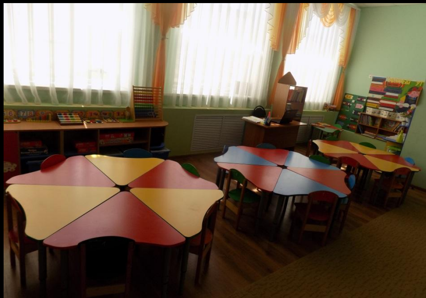
Нижняя правая точка