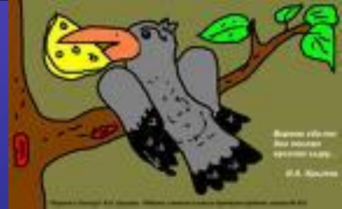
Иллюстрация – рисунок, фотография или другая работа, которая создается с целью выделить субъект, а не форму.

Назначение иллюстрации- объяснить или декорировать текстовое содержание книги, журнала, газеты.