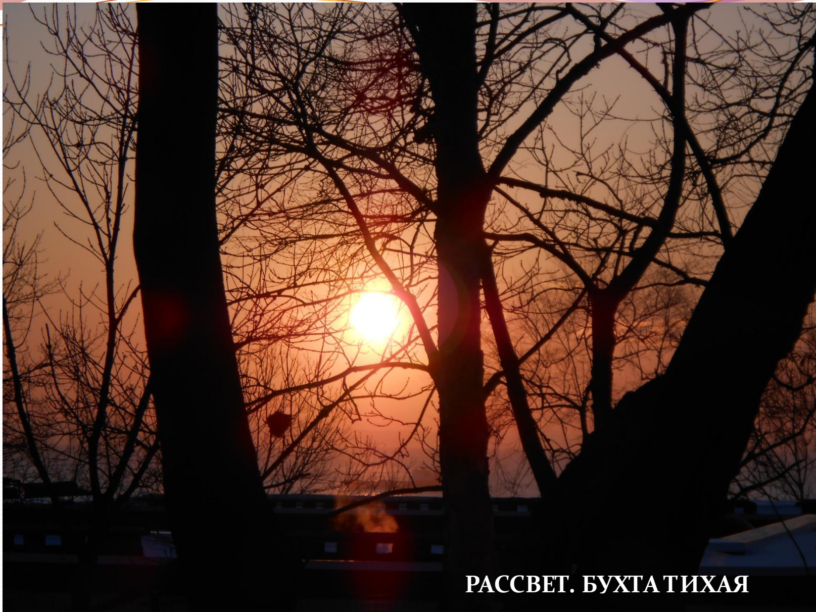
РАССВЕТ. БУХТА ТИХАЯ