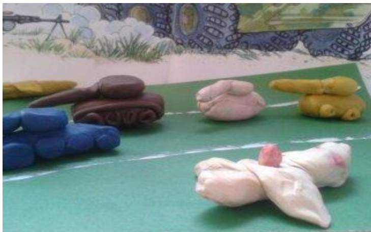
«Боевые танки и самолеты»