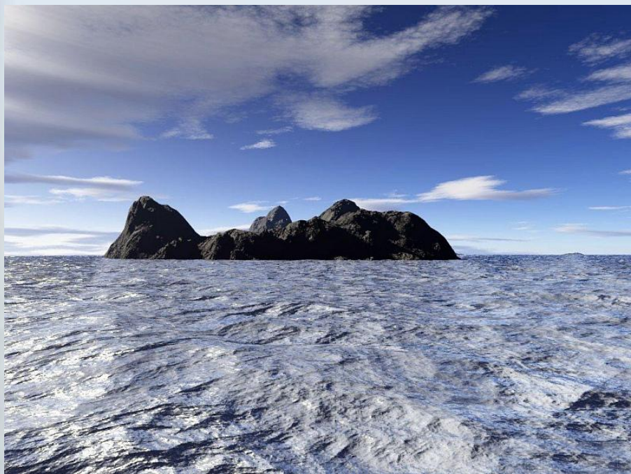
скалы, море, небо