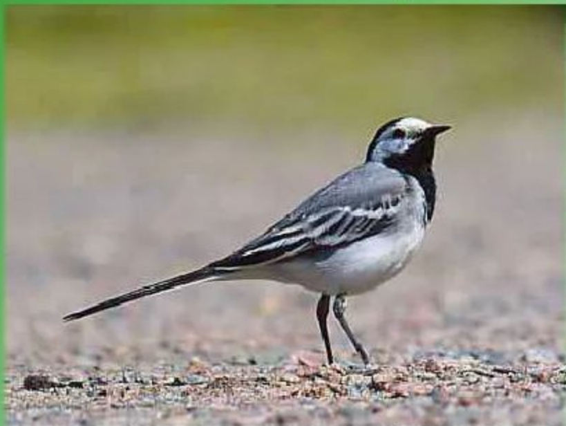
Трясогузка белая - Motacilla alba