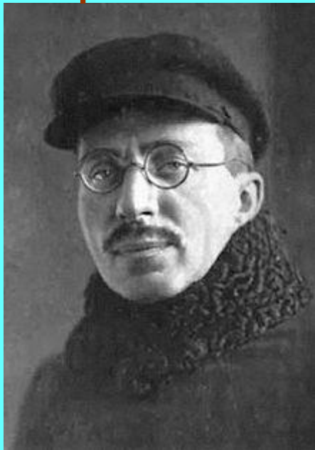
Антон Семёнович Макаренко