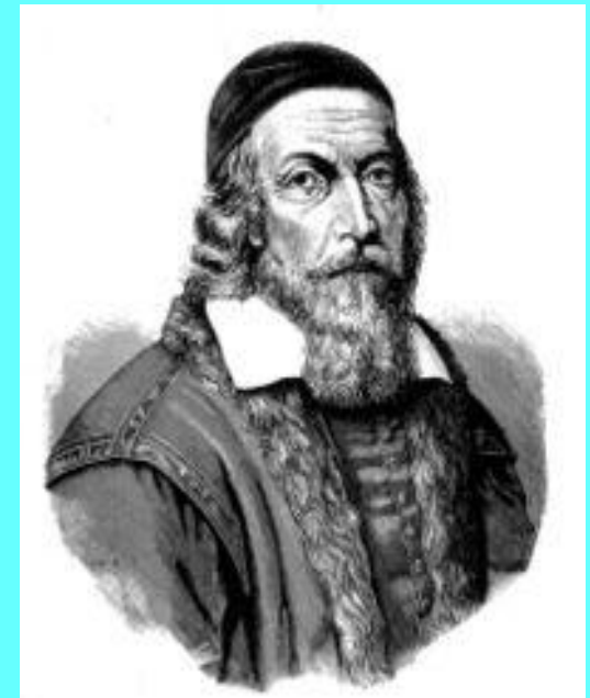
Ян Амос Коменский Jan Amos Komensky

Дата рождения: 28 марта 1592 Известен как: «Отец педагогике»