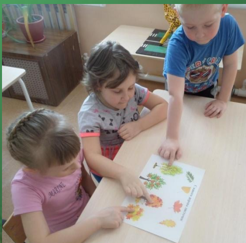
Экологическая игра «С чьей ветки детки?»