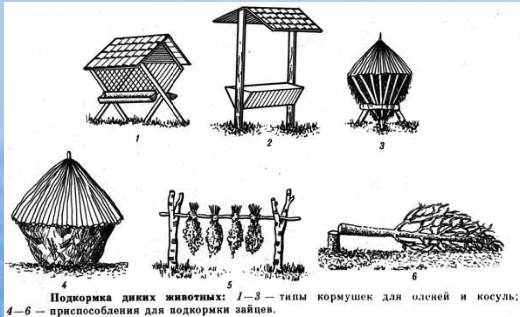
Подкормка диких животных: 1—3 — типы кормушек для оленей и косуль; 4—6 — приспособления для подкормки зайцев.