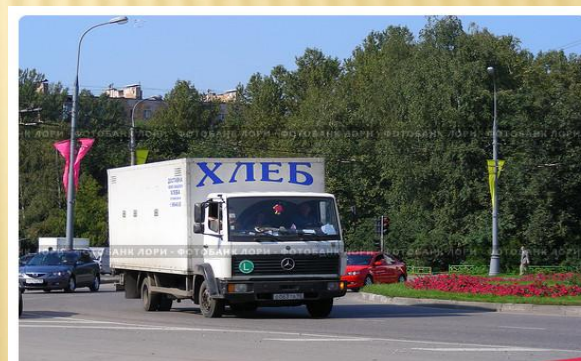
Грузовая машина "Хлеб" едет по дороге