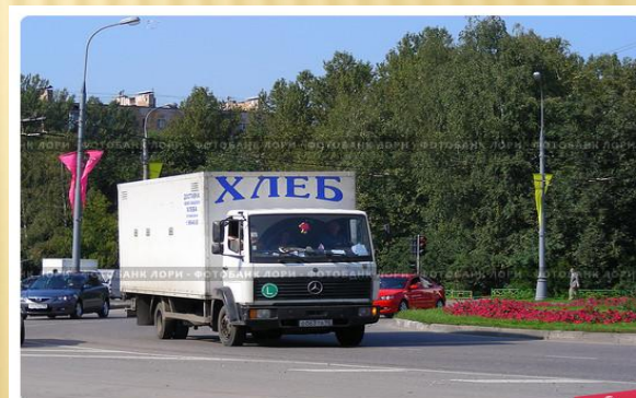
Грузовая машина "Хлеб" едет по дороге