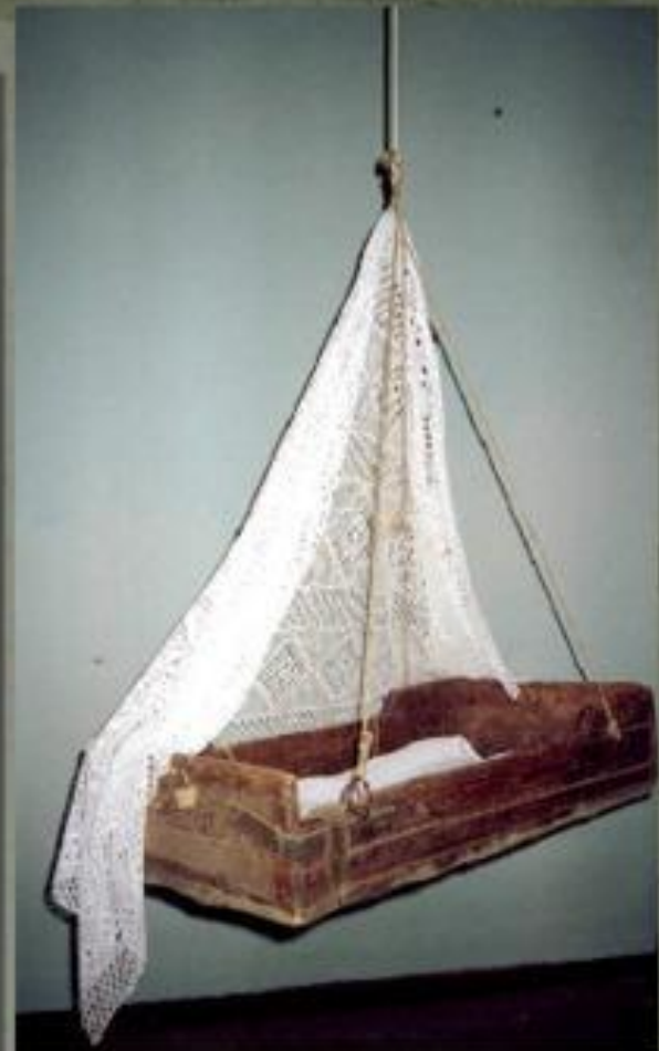
"Калыска" - детская люлька в кружевах и оберегах