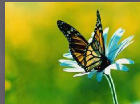
Изящные очертания цветов, бабочек...