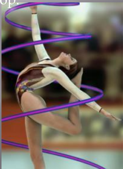
Пластика человеческого тела