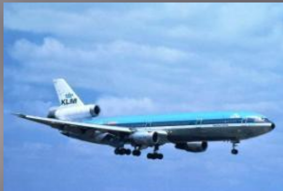
Обтекаемые формы самолетов и автомобилей