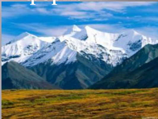
Величественные очертания гор.

Все что нас окружает поражает разнообразием форм.