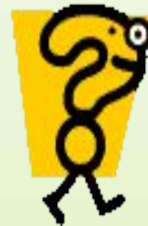
рис – рисунок