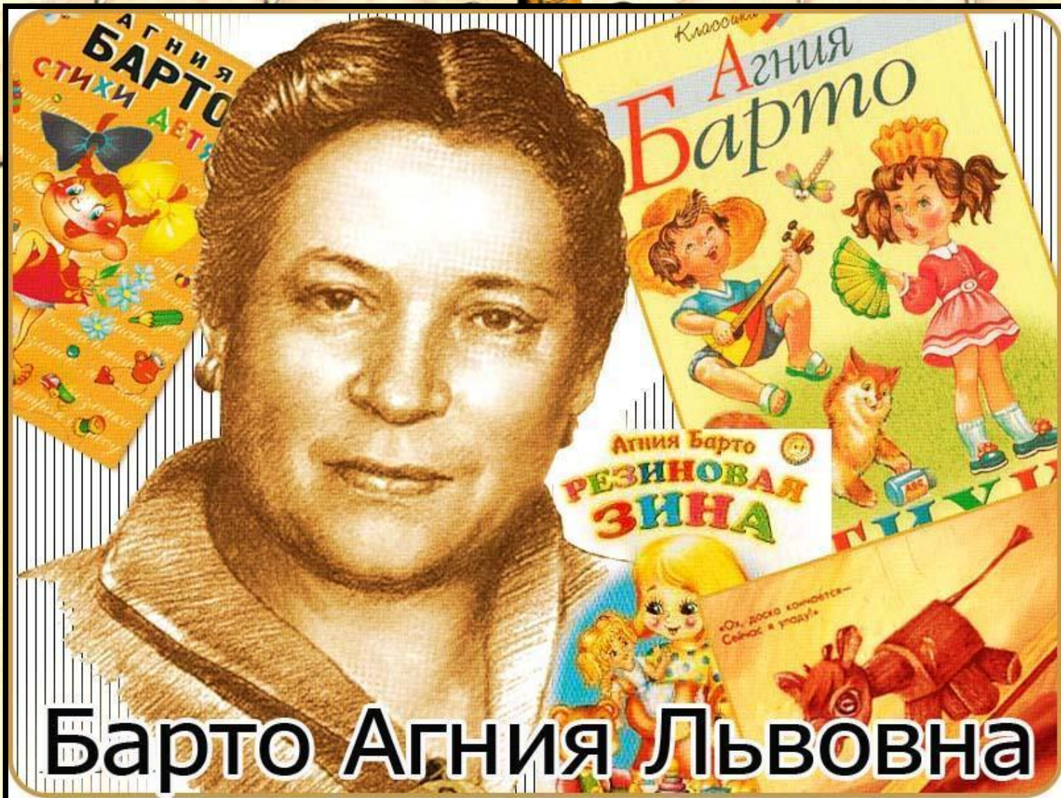
Барто Агния Львовна