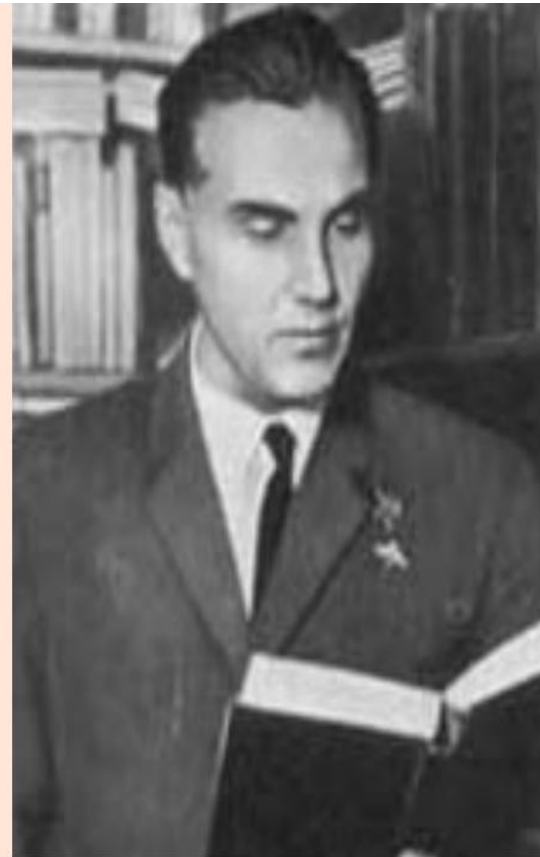
Сухомилинський Василь Олександрович

(1918-1970) педагог, публіцист, письменник