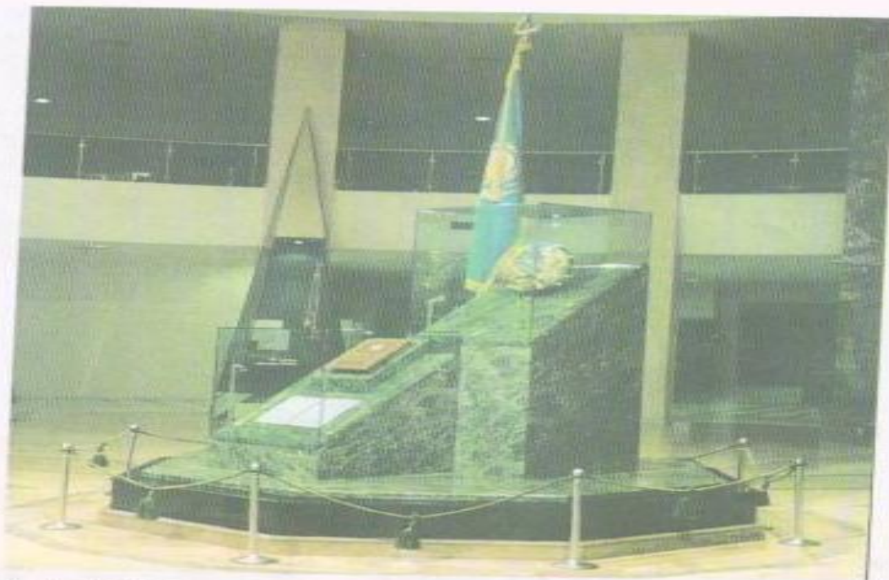
Еліміздің Туы, Елтаңбасы, Әнұраны, Конституциясы қойылған орын. ҚР Президенттік мәдениет орталығы.

1992 жылы 4-маусымда жаңа мемлекеттік рәміздер