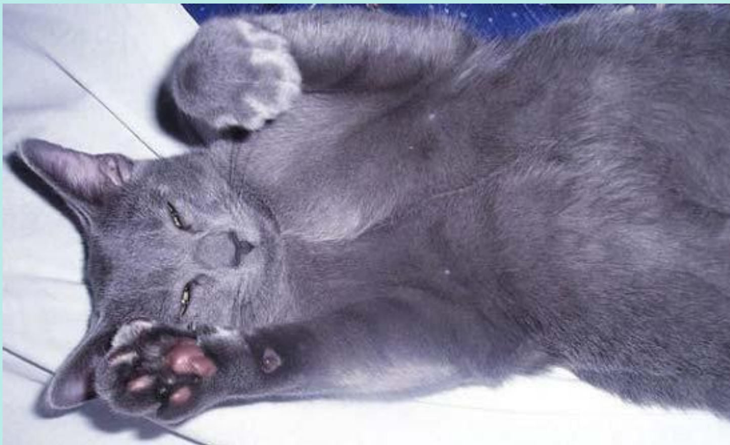
Русская голубая кошка