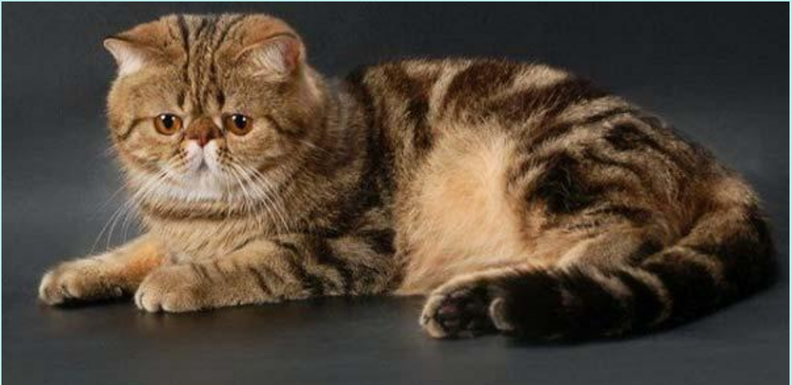
Экзотическая короткошерстная кошка