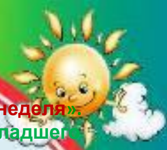
Фото - отчёт.