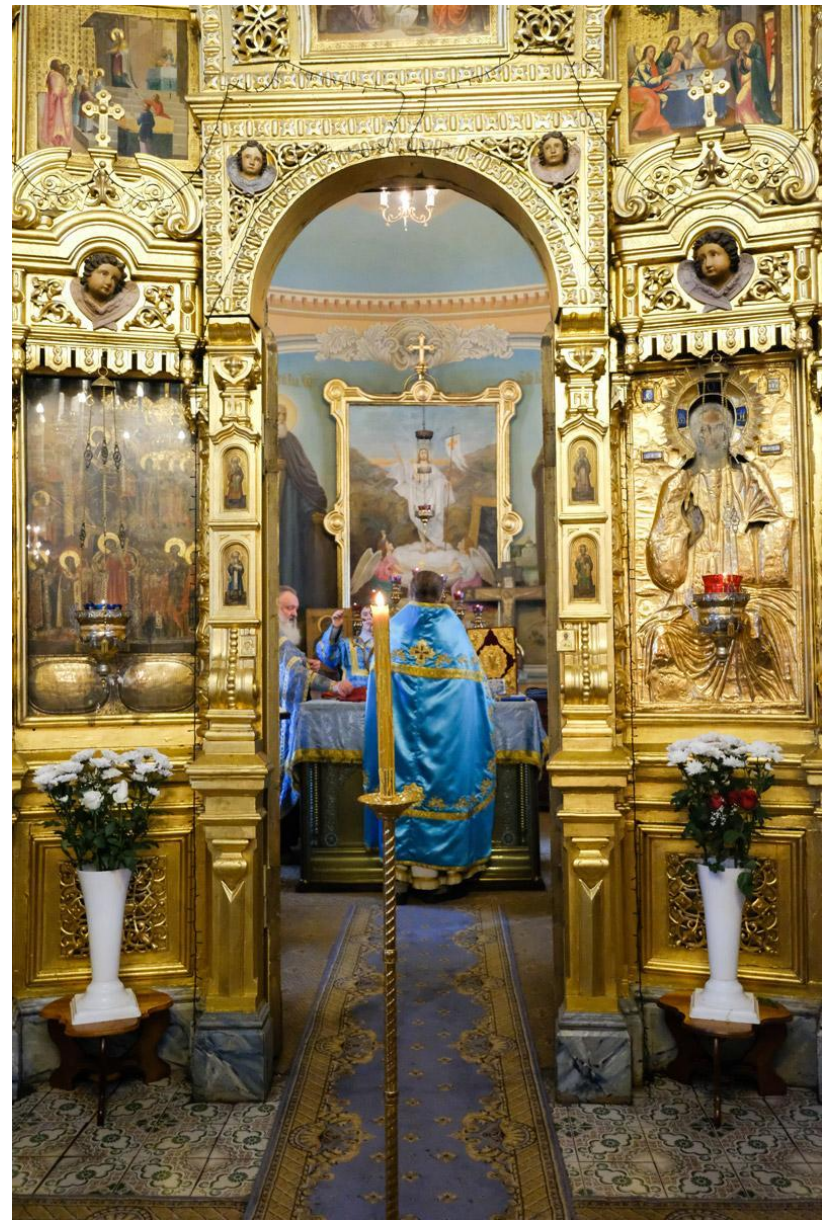
Самое таинственное место в Храме – Алтарь. В Алтарь ведут Царские врата.