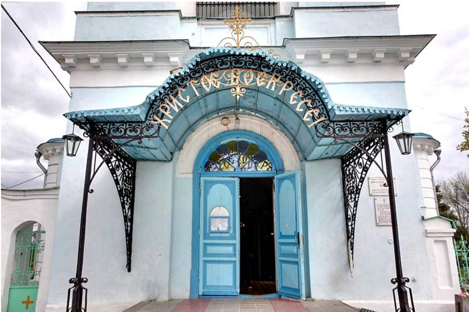
Место перед входом в храм, невысокое крыльцо, называется папертью.