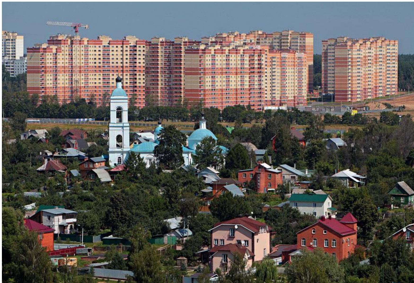
Третий век Покровской Церкви...