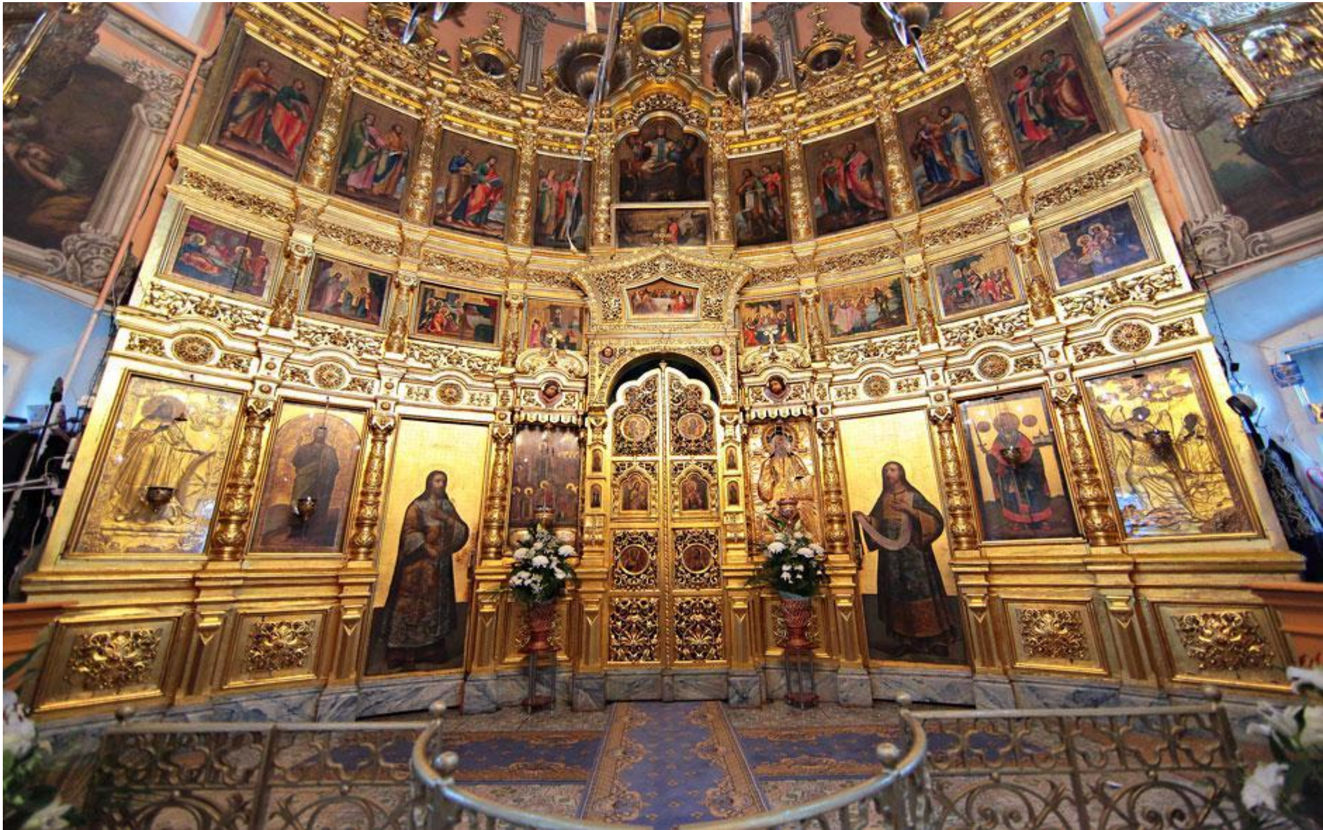
Центральный предел в честь иконы Покрова Пресвятой Богородицы. Иконостас