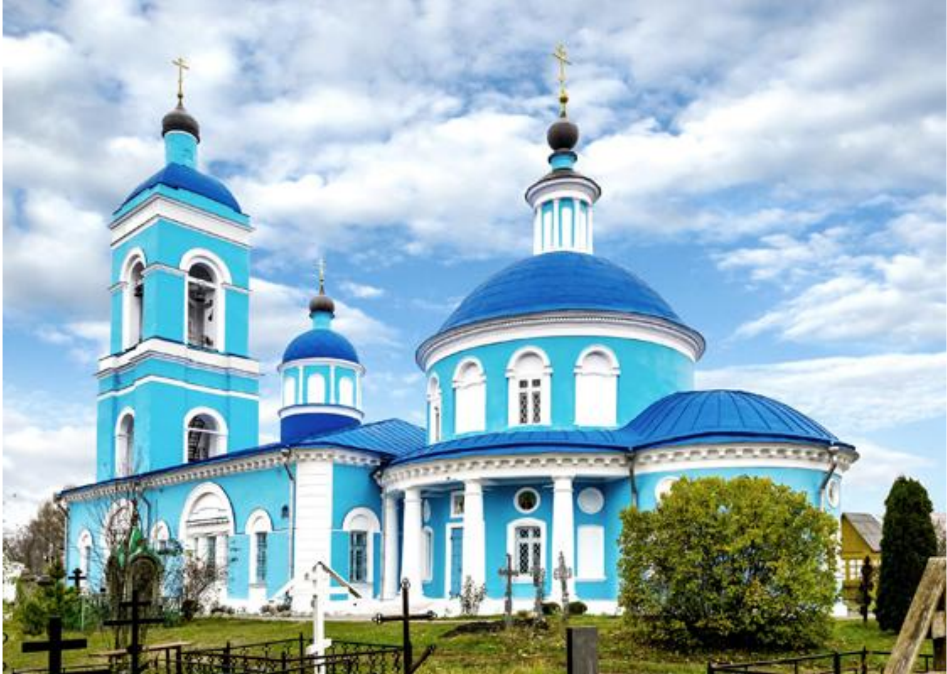
Храм Покрова Пресвятой Богородицы г. Щелково. Храм похож на корабль: высокая колокольня как мачта. На мачте корабля реет флаг, а на колокольне сияет крест.