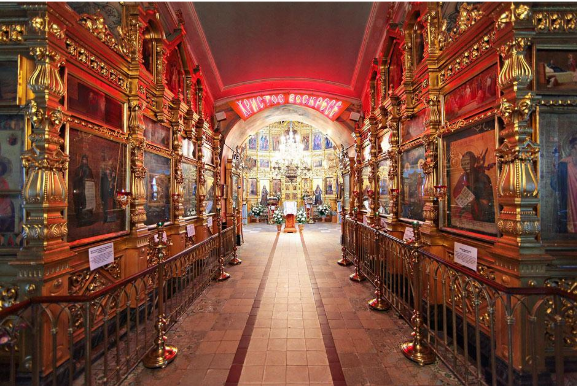
Внутри храм расписан фресками. На стенах иконы, а у икон горят лампы и свечи.