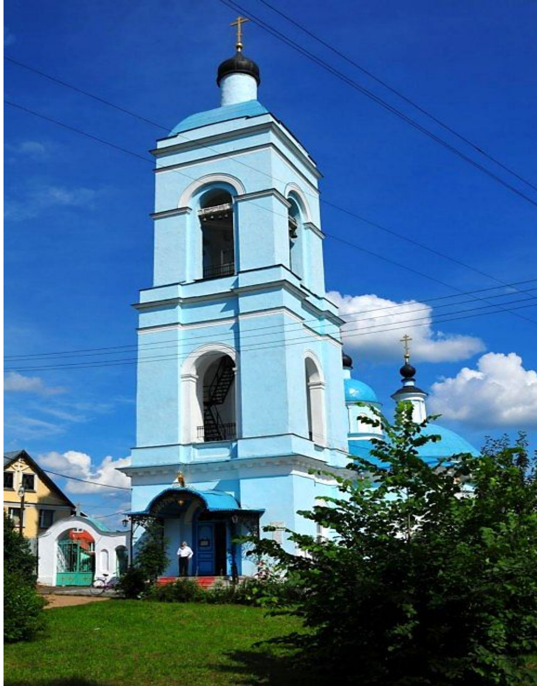
Колокольня Покровского Храма