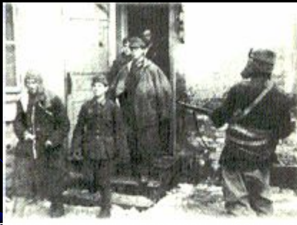
Румынские солдаты в плену у партизан. Кубань, начало 1943 г.