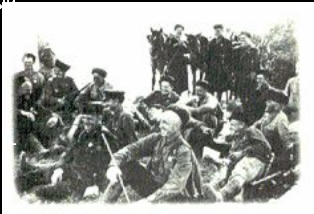
Бойцы 4-го Кубанского гвардейского кавалерийского корпуса на привале. 1942г.

К июлю 1942 г., когда война пришла на землю Кубани, каждый пятый житель края ушел на фронт. Из добровольцев было создано более 90 истребительных батальонов и три казачьих соединения — 50-я отдельная кавалерийская дивизия, 4-й Кубанский гвардейский кавалерийский корпус и Краснодарская пластунская дивизия.