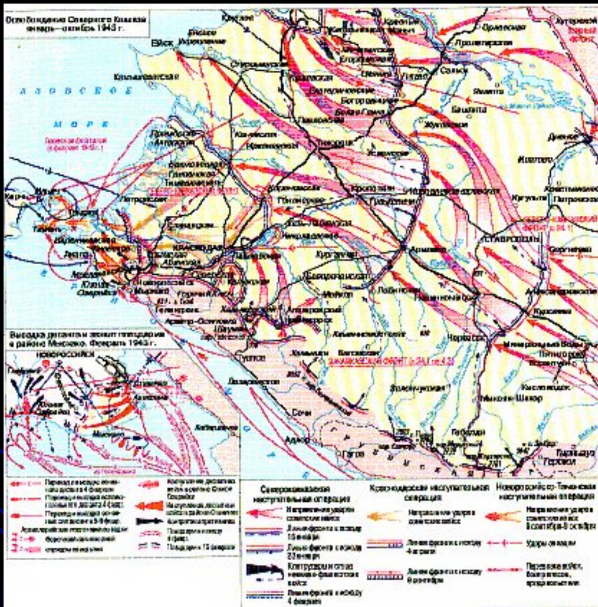
Освобождение края завершилось в ходе Новороссийско-Таманской операции.