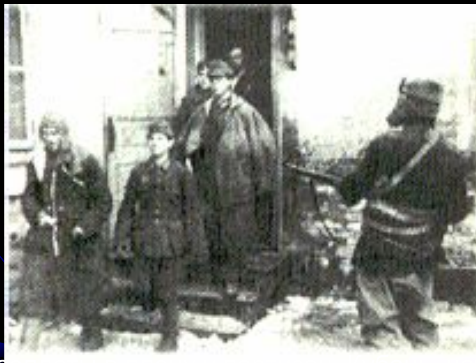
Румынские солдаты в плену у партизан. Кубань, начало 1943 г.