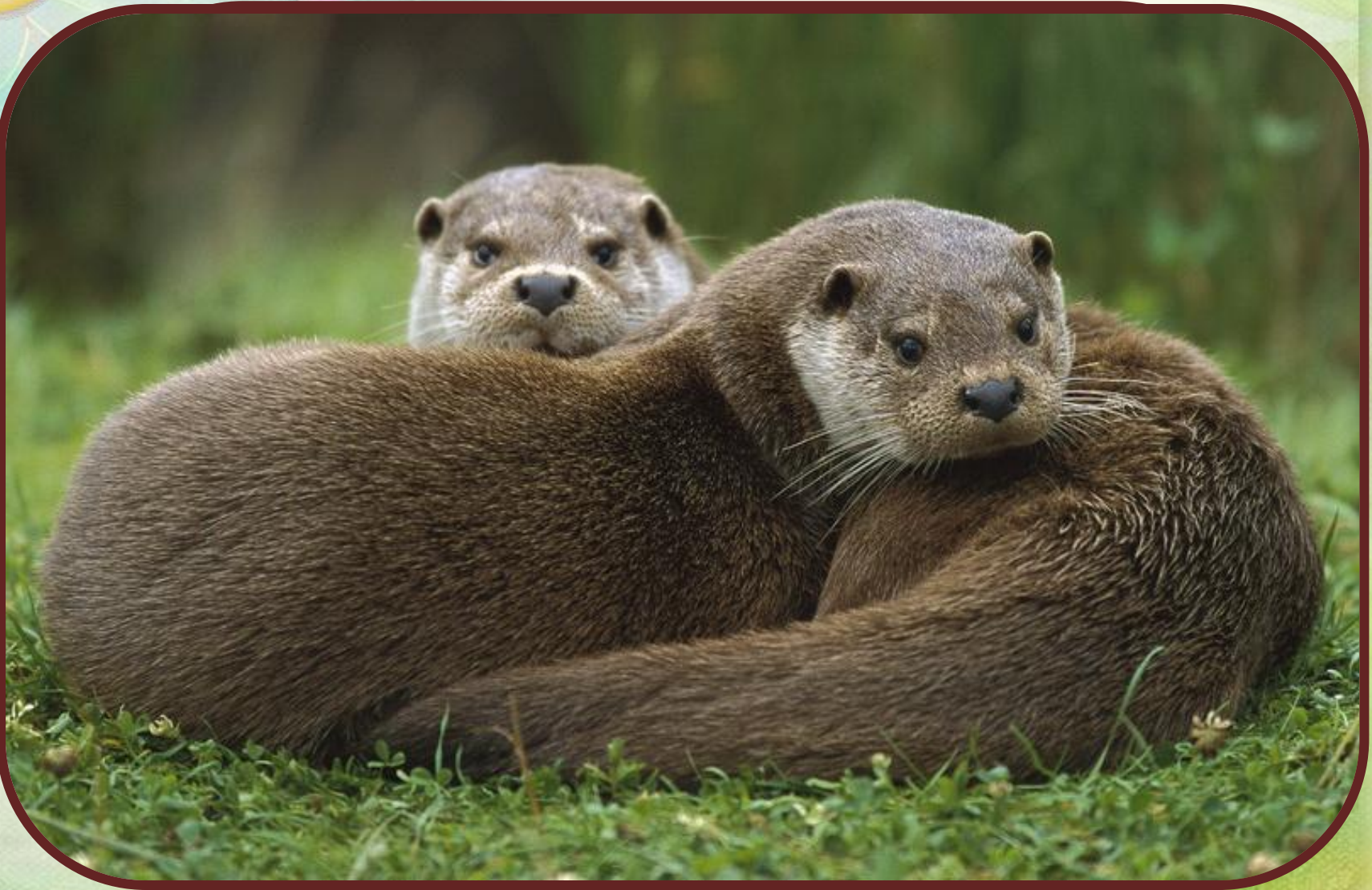
Выдра, барсук и глухарь