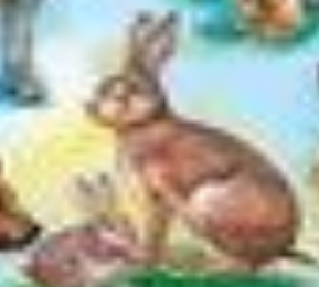
Заяц и зайчата