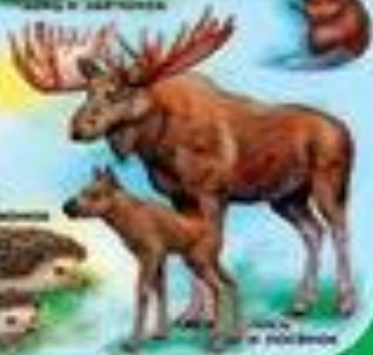
Олень и олененок