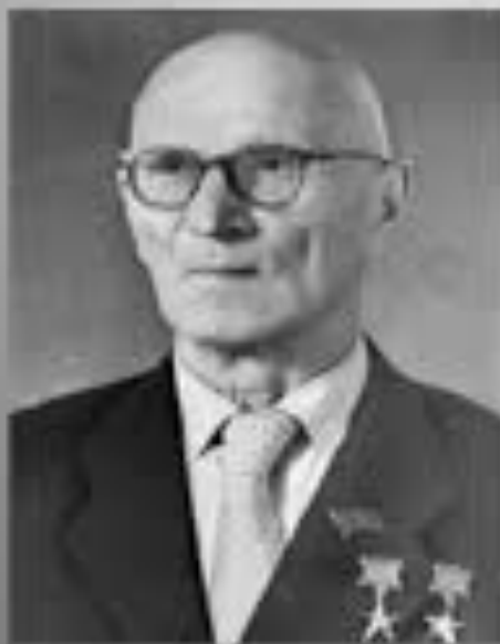
Василий Степанович Пустовойт

Создал, сорта подсолнечника, пшеницы, ржи, проса и кукурузы, отличающиеся высоким качеством.