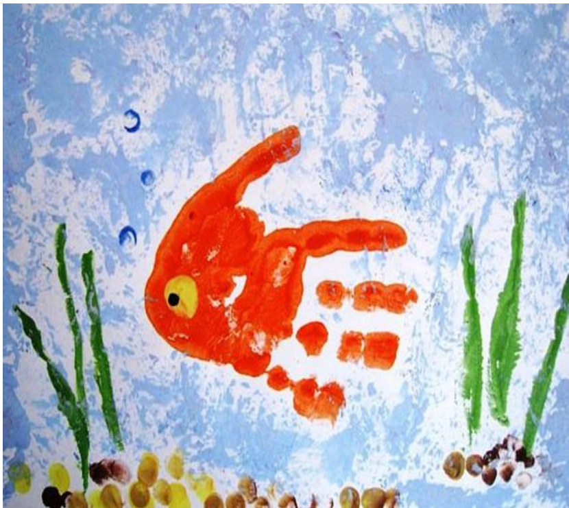
Рисунок ладошками прекрасно развивает мелкую моторику, которая оказывает огромное влияние на речь и память ребенка. Ребенок начинает творить исходя из своего возраста,

учится различным техникам рисования, которые пригодятся ему в дальнейшем при создании более взрослых и осознанных шедевров.