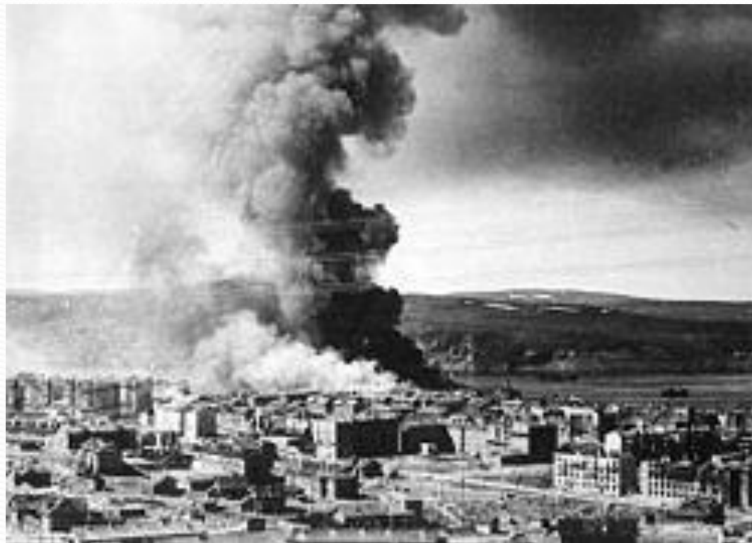
Пожар после бомбардировки города, 1942 год

В ходе Великой Отечественной войны по количеству и плотности нанесённых по городу бомбовых ударов Мурманск уступает лишь Сталинграду. В результате бомбардировок было уничтожено три четверти построек. 7 октября 1944 года советские войска начали в Заполярье наступательную операцию, и угроза Мурманску была снята.