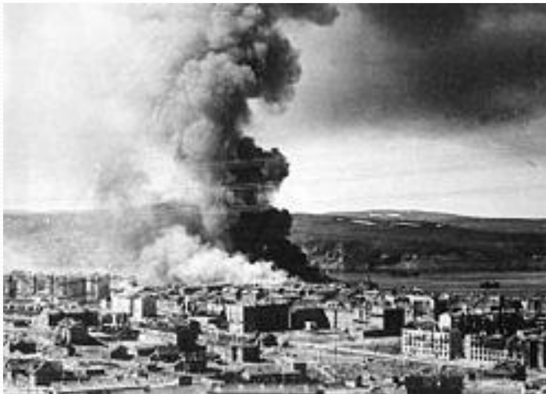
Пожар после бомбардировки города, 1942 год

В ходе Великой Отечественной войны по количеству и плотности нанесённых по городу бомбовых ударов Мурманск уступает лишь Сталинграду. В результате бомбардировок было уничтожено три четверти построек. 7 октября 1944 года советские войска начали в Заполярье наступательную операцию, и угроза Мурманску была снята.