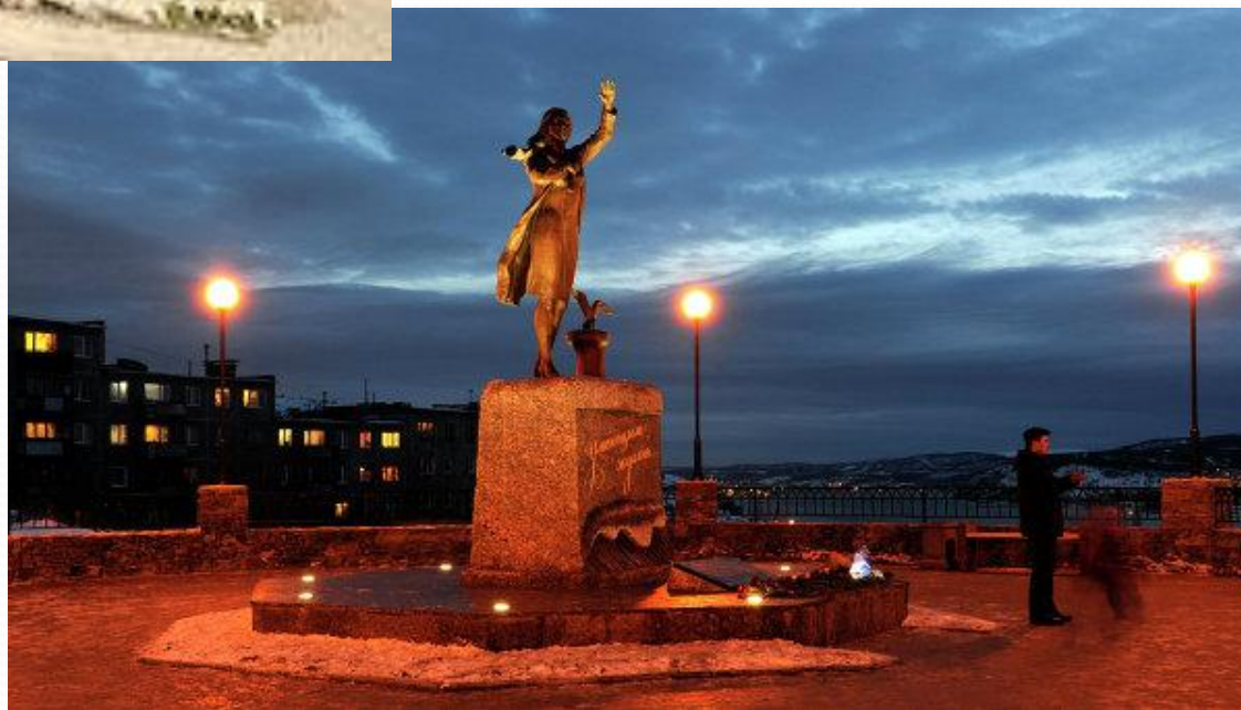
Памятник жёнам моряков.