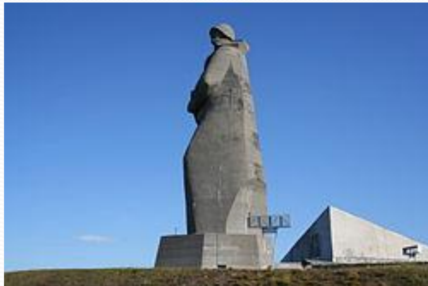
памятник защитникам Советского Заполярья (Мурманский Алёша).