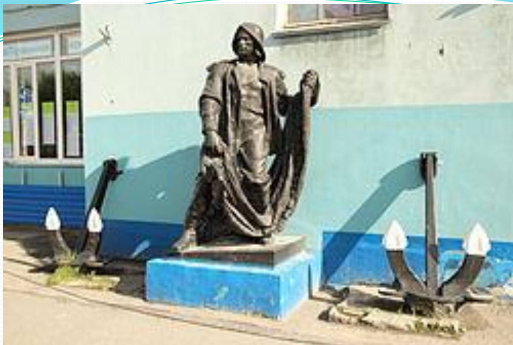
Скульптура рыбака у здания морского колледжа имени И.И. Месяцева.