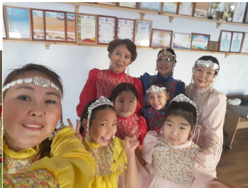
Гастроли в с.Уёдэй, Намский улус