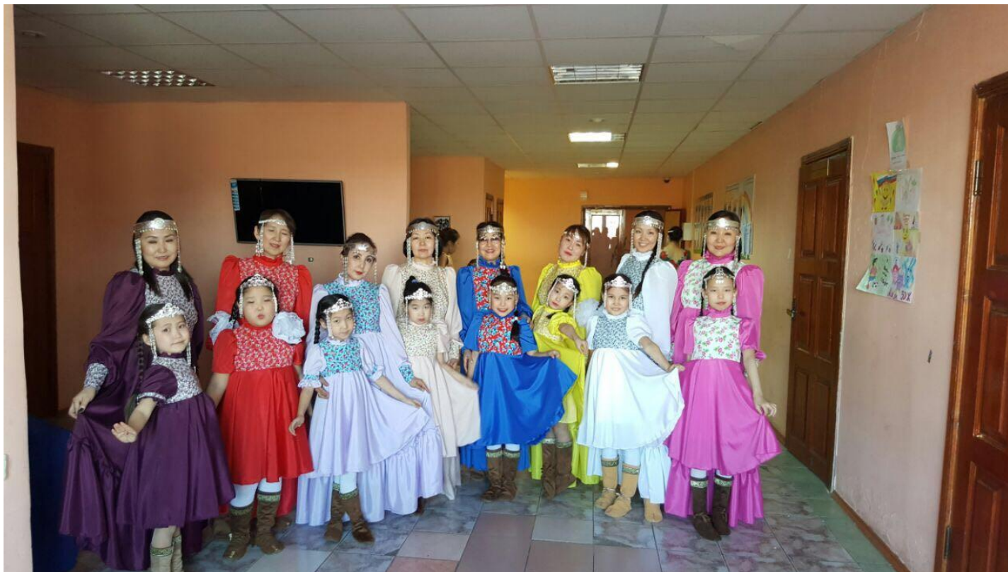
Гастроли в с. Төхтүр, Хангаласский улус