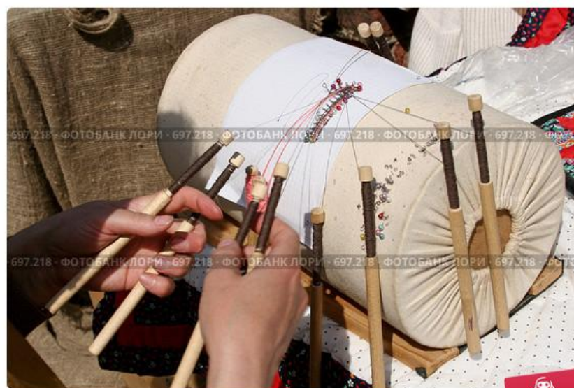
Плетение кружев на коклюшках